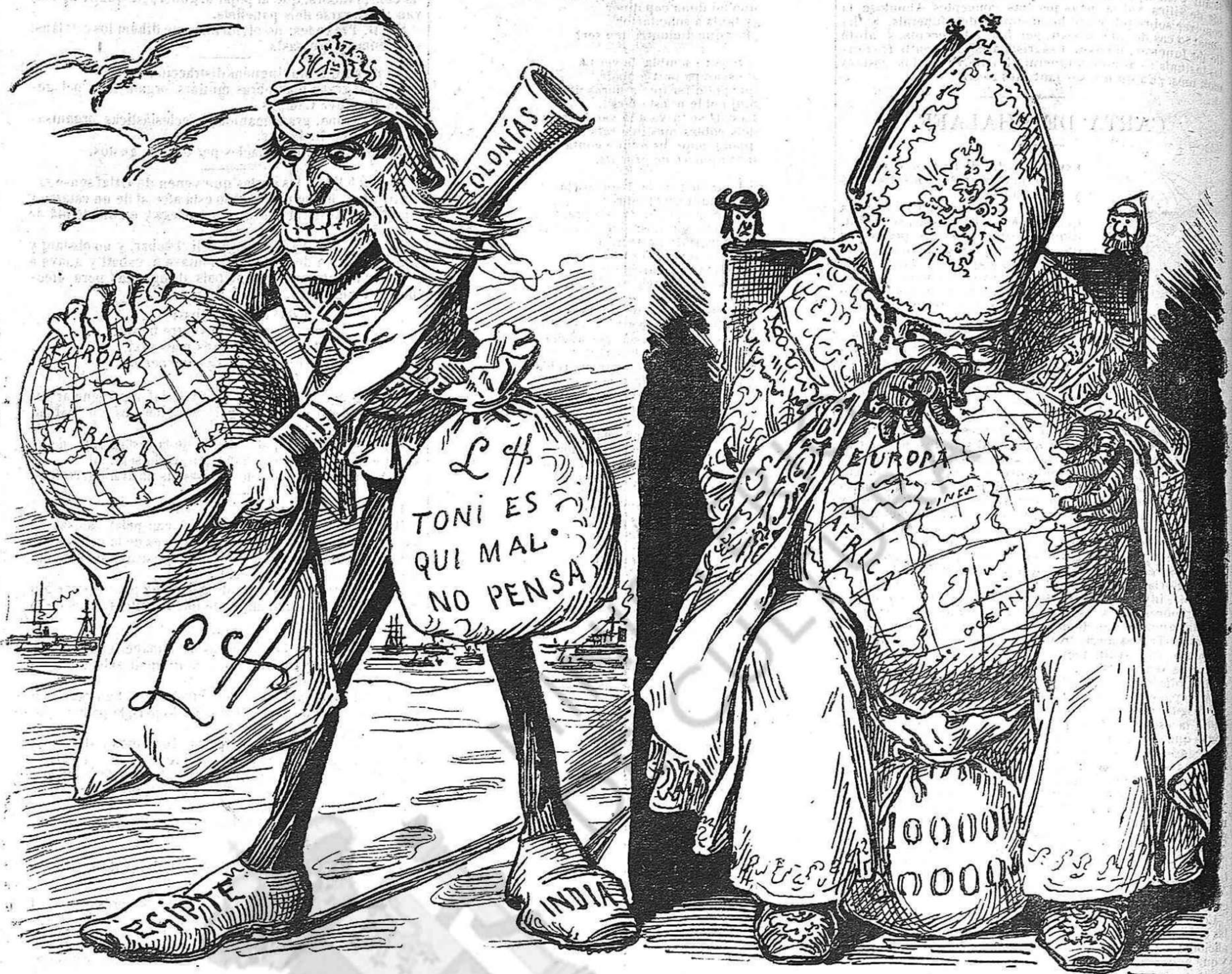
Distintas ideas tenen mes portan lo mateix tí: en religió no s' avene i; pero en lo negoci sí.

Ab una mica més s' estableix la huelga general, per ordre del bisbe.