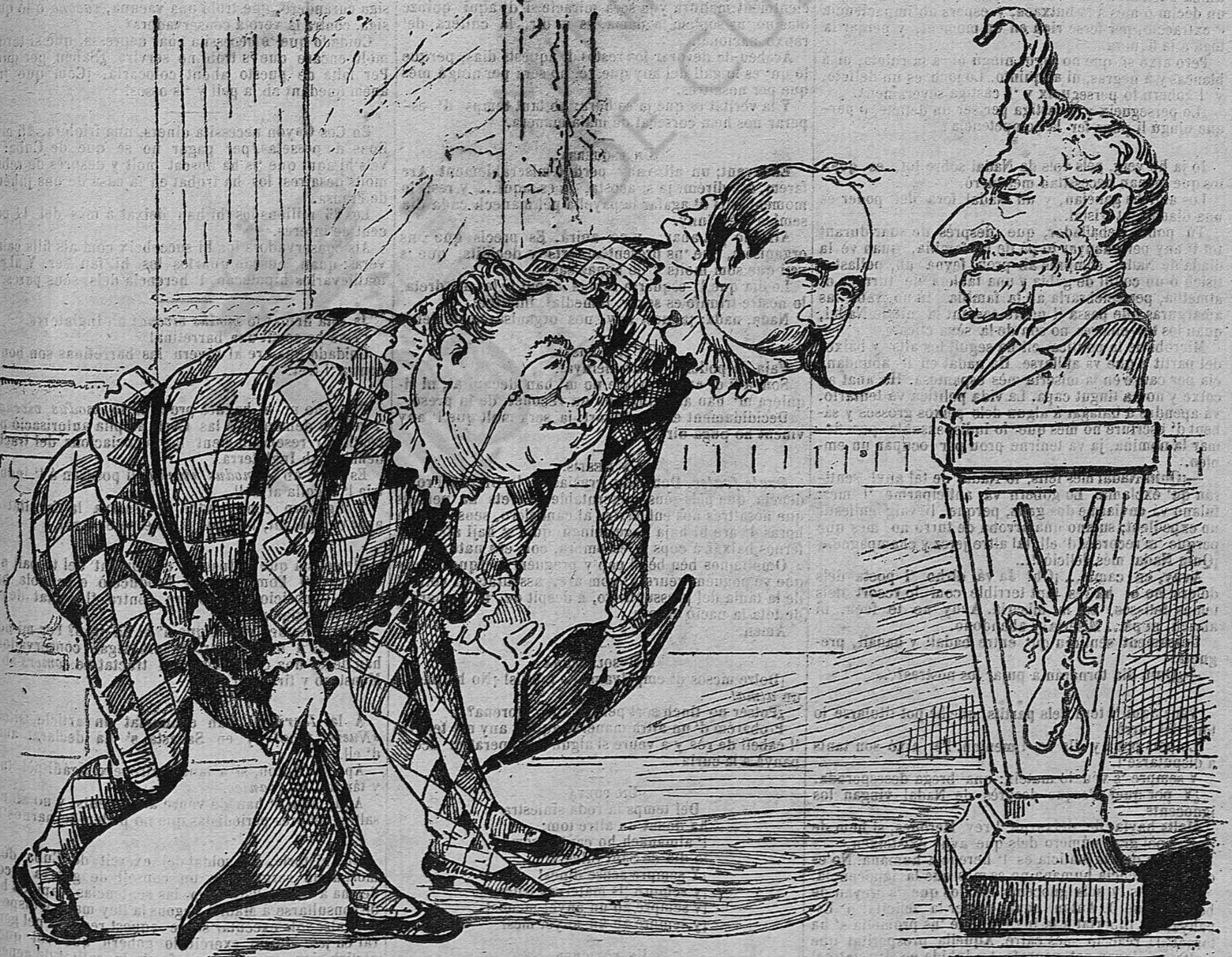
—Ave Sagasta, VIVITURI te salutant.