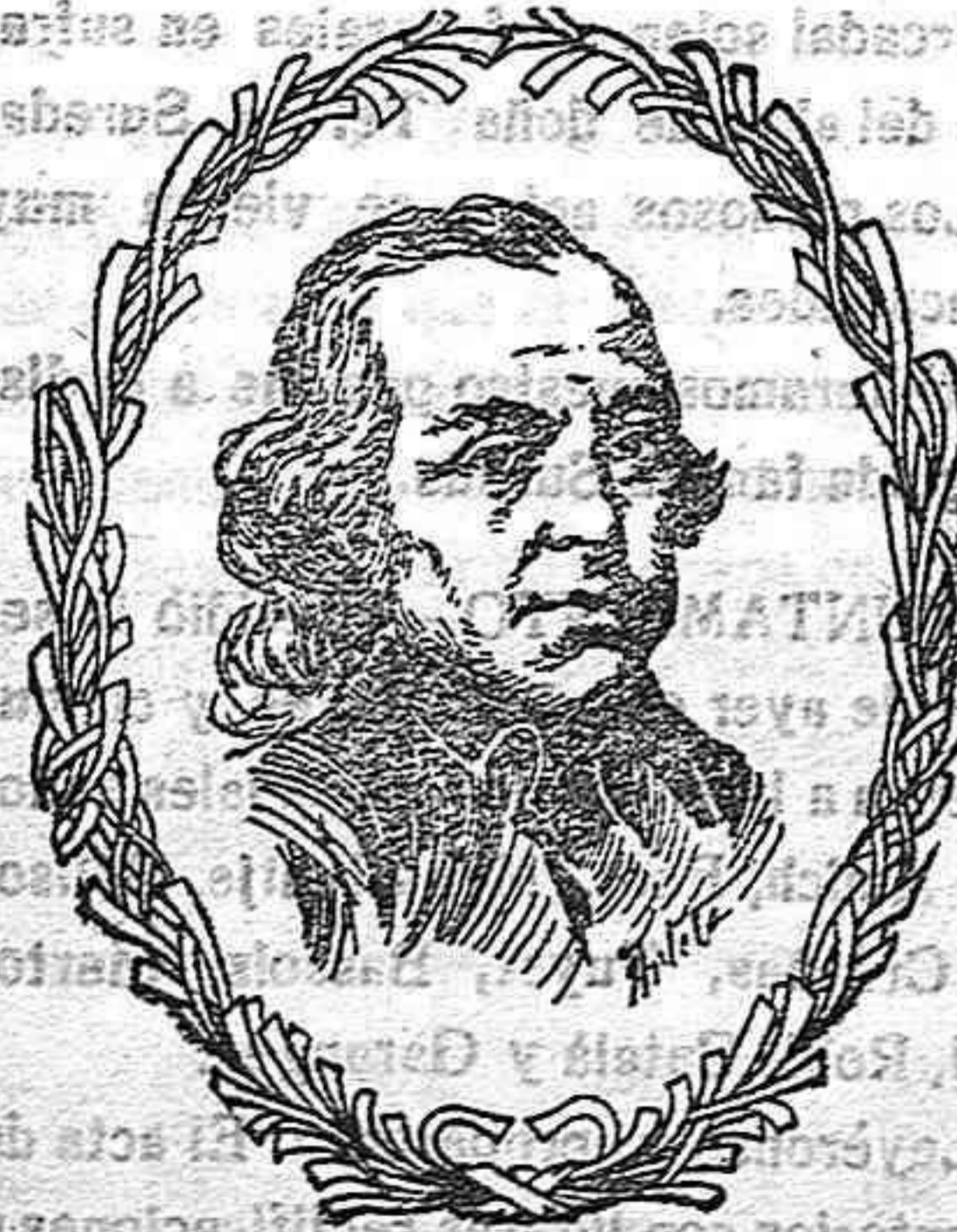
El abate L' Epée

Bien puede decirse que pocos hombres se han hecho merecedores al eterno agradecimiento de la Humanidad como el abate L' Epée; a él se debe la invención del alfabeto manual para los