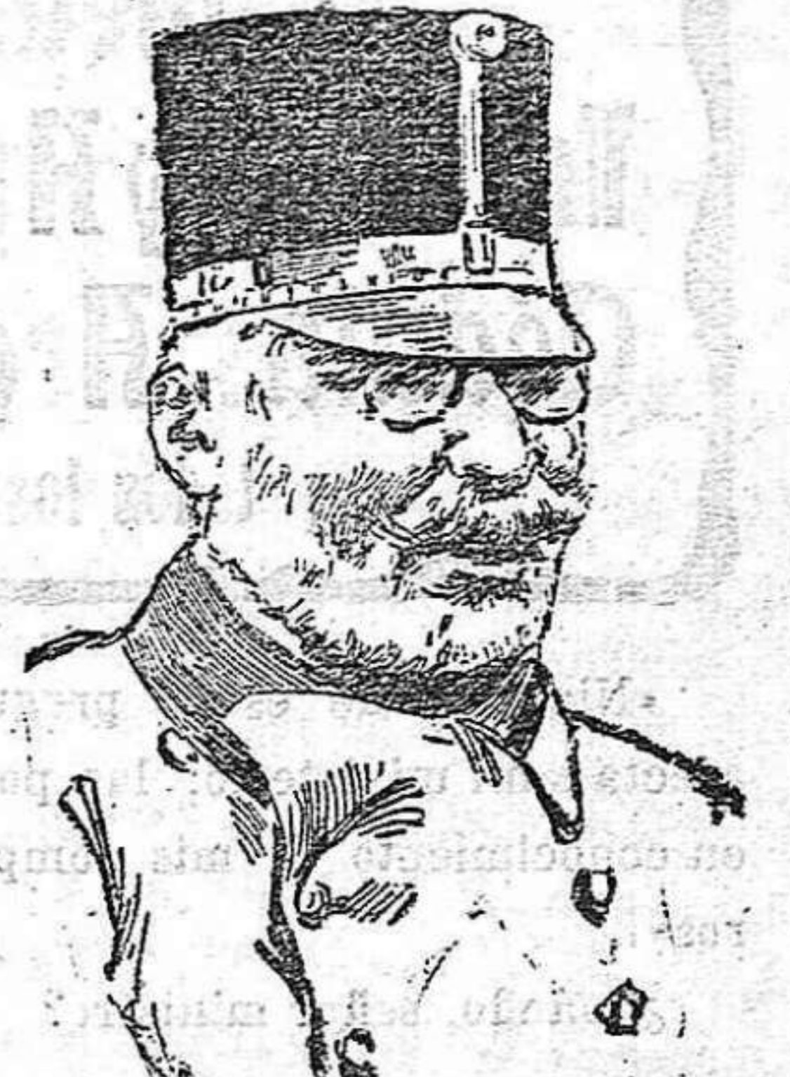
General Meritz von Auffenberg

Comandante de uno de los ejércitos alemanes de Polonia, y conquistador de Lodz.