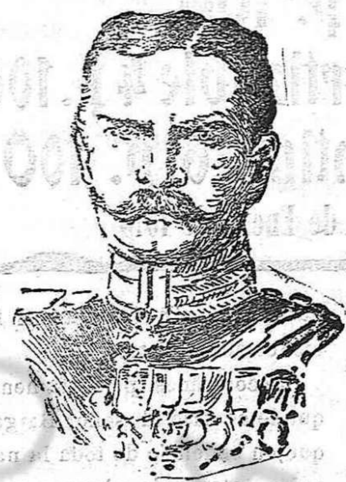
General von Mackensen

Todo esto, según nos cuentan las Agencias telegráficas, que se han olvidado de decirnos por dónde han pasado la frontera y dónde han cogido tanto prisionero, que unido a los miles anteriores, ya no deben tener lugar para custodiarlos.