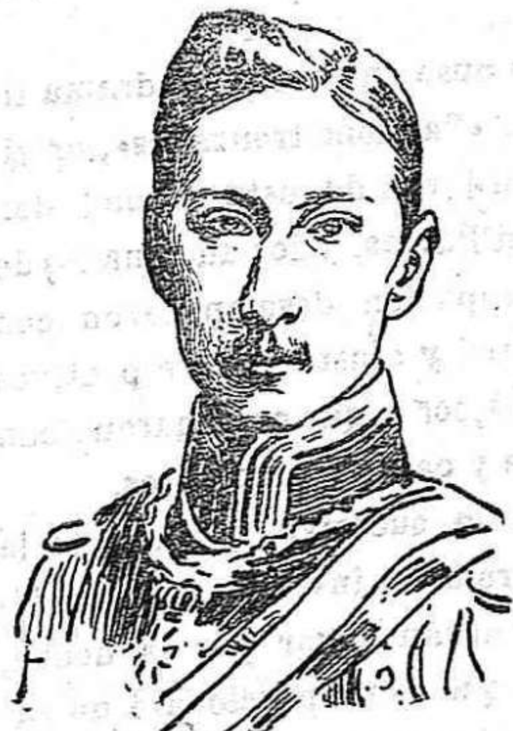
EL KRONPRINZ Guillermo de Alemania

Hay trances en que quisieramos ser optimistas.—F.