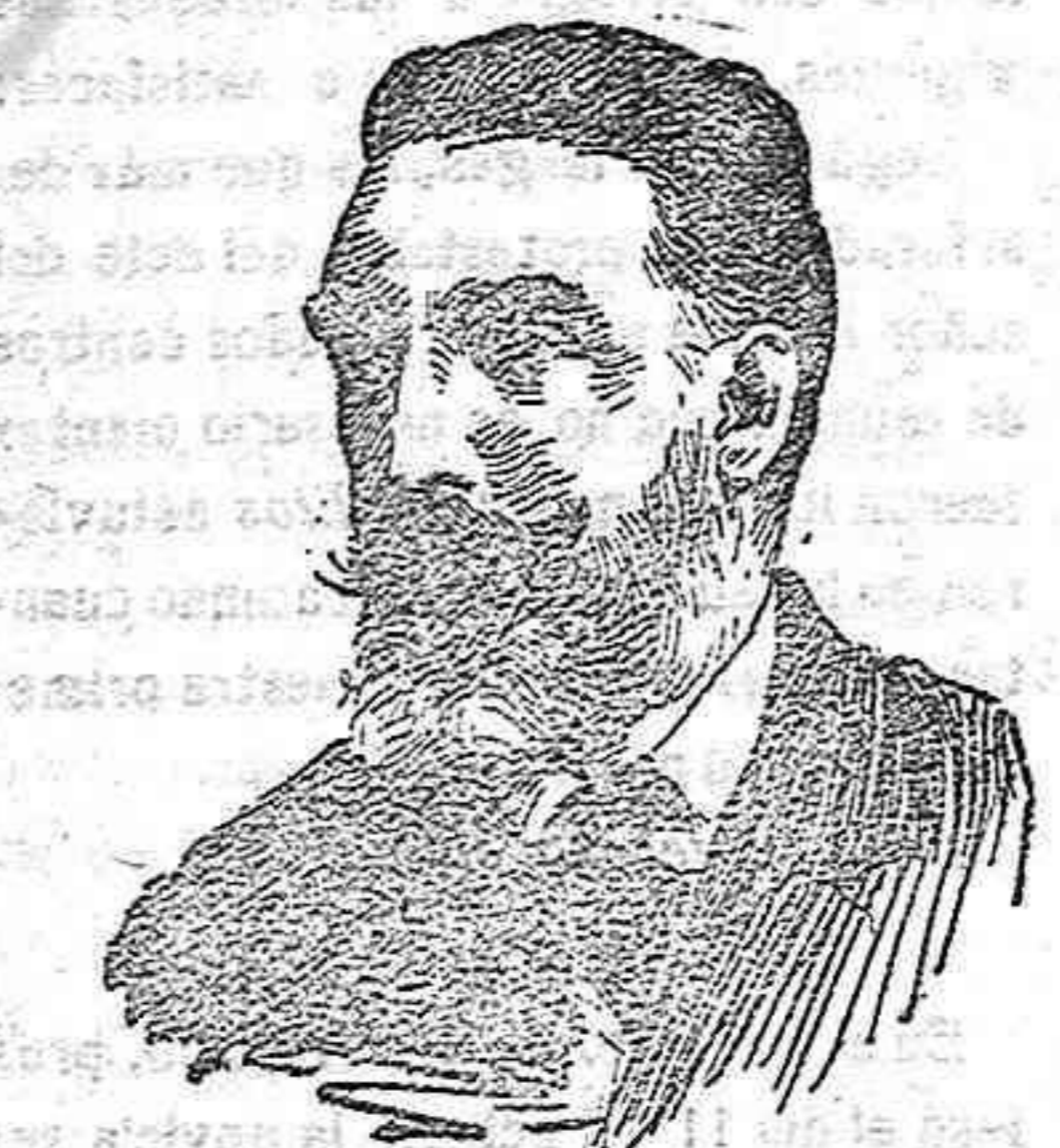
Don Fermín Calbetón, nuevo embajador de España en el Vaticano.

El Arzobispo de Mira será, pues, digno sucesor de su eminencia el Cardenal Vico, que tan gratos recuerdos dejó entre nosotros.