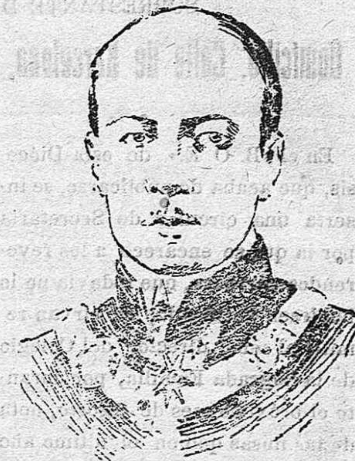
El Conde Graf Berchtold

ministro de Estado de Austria y autor de la nota ultimatum que ha provocado la guerra austro-serbia.