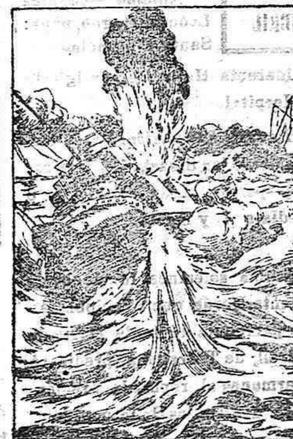
Cazatorpederos austro-húngaros Trigla y Siba en combate con la batería italiana de Valona.