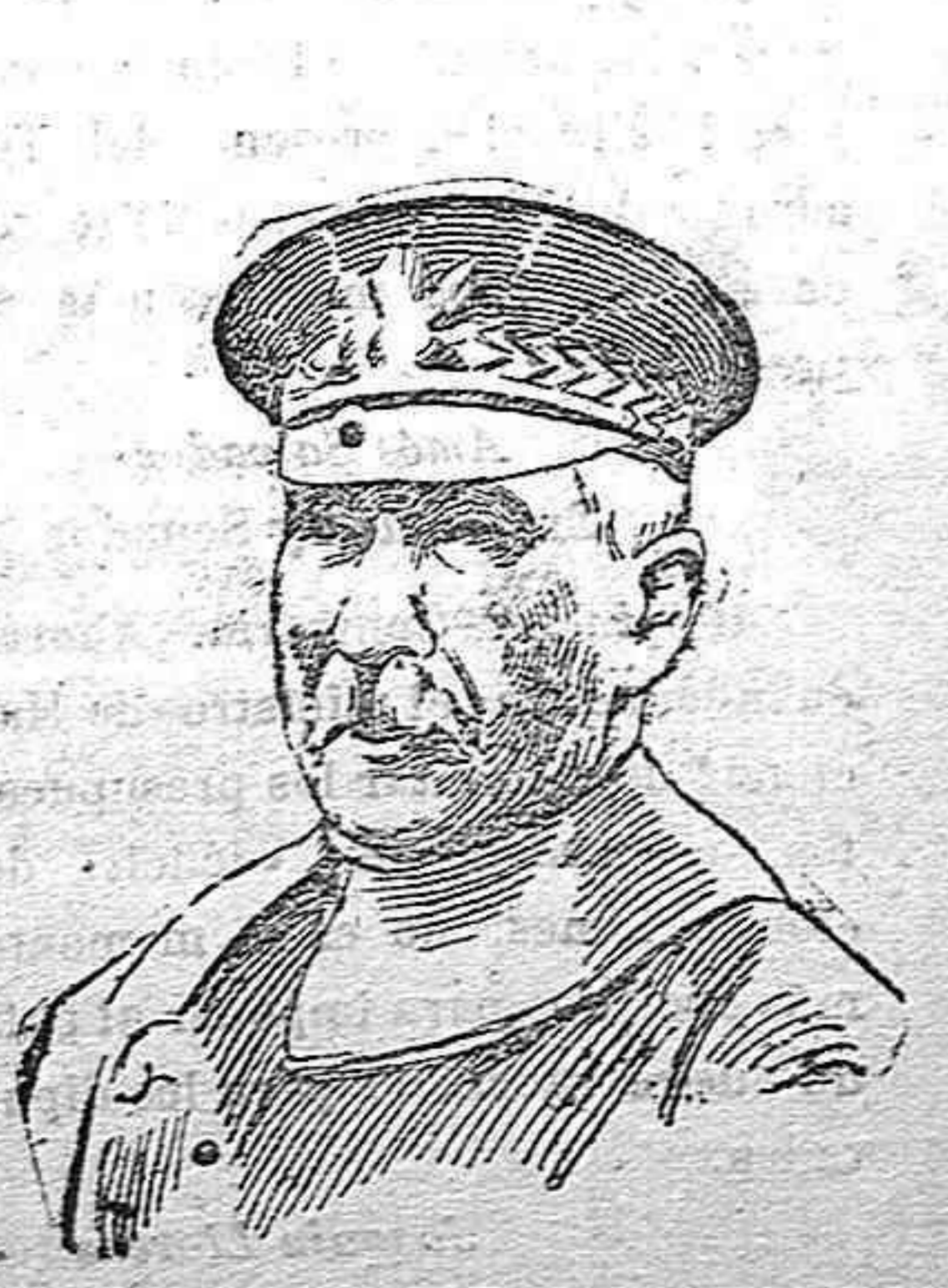
Mayor general Vood, comandante en jefe del Ejército norte-americano destinado a la ocupación de Méjico.