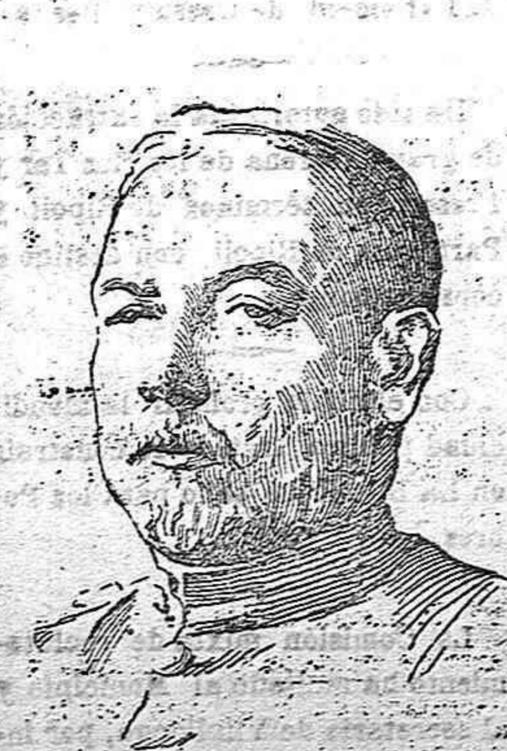
General Junstón, gobernador de Veracruz y jefe de las tropas yanquis que ocupan esta ciudad.