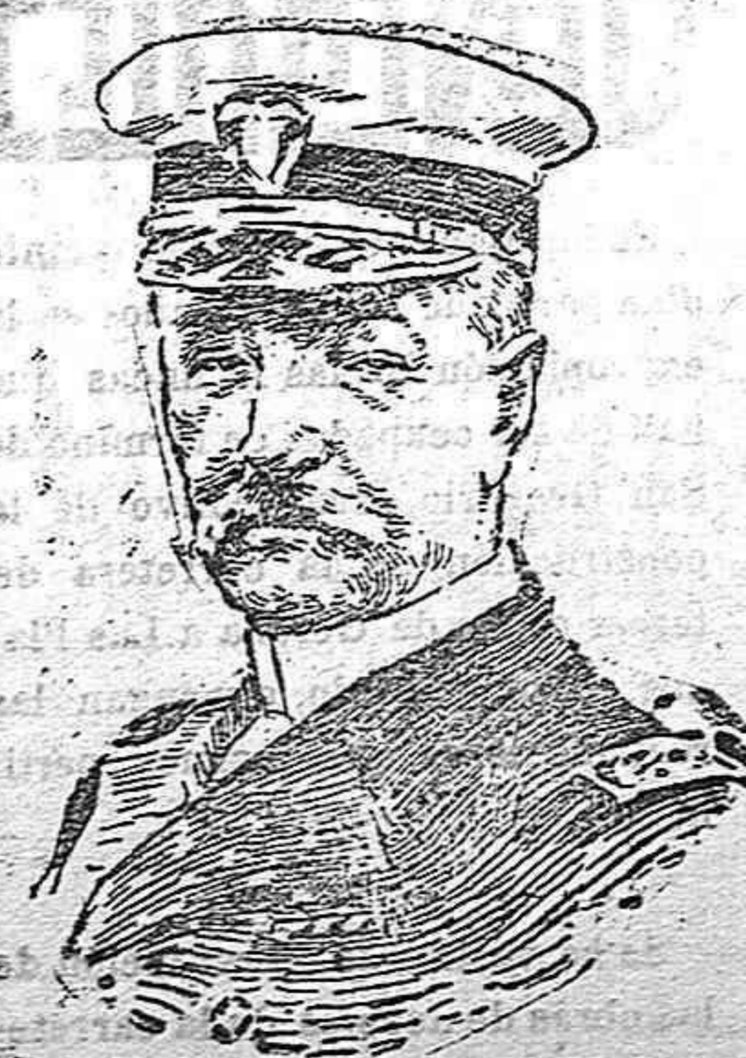
Almirante Badger, que manda la escuadra norteamericana del Pacífico