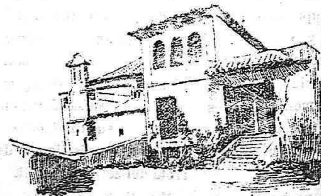
Casa que en Toledo habitó el Greco, hoy convertida en museo de muhas de las otras del mismo.

Toledo se dispone a celebrar dignamente el centenario del Greco. Tras de la serie de conferencias que en ella se vienen celebrando, llegarán las solemnidades de carácter literario y artístico que se preparan, y durante el mes de Abril, Toledo será visitado por millares de admiradores del autor del Entierro del Conde de Orgaz, que acudirán a su Museo y a sus iglesias a admirar y estudiar el conjunto que en ellas ofrecen las obras pictóricas de tan original artista.