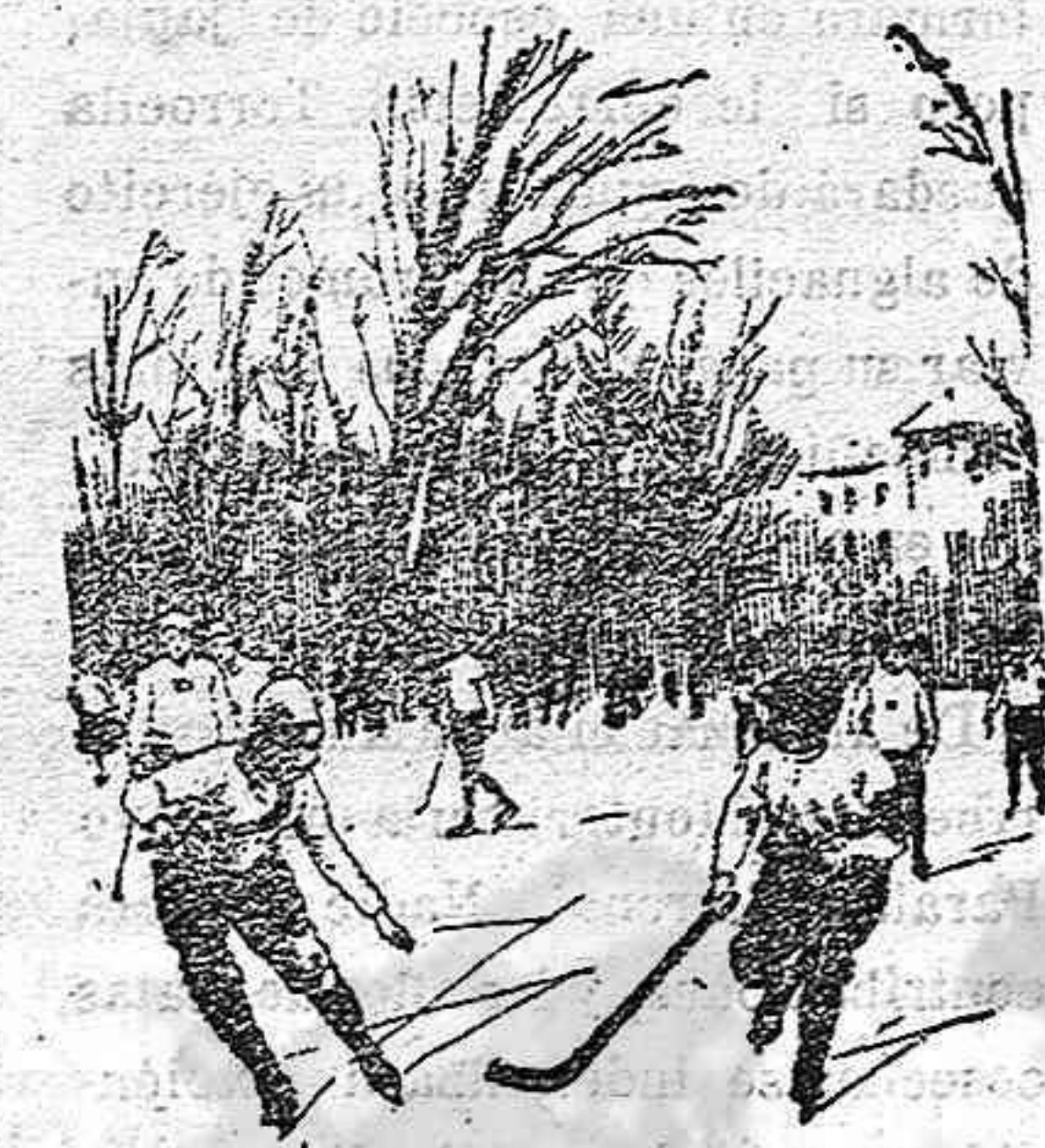
Una partida de «hoc'eywett'piel» en el Parque Botánico de Berlín.

Los grandes parques y los lagos próximos a la ciudad de los már-moles y de los bronceos, ofrecen a los deportistas amplios y bellos es-cenarios para sus distracciones. La falta de pendientes les priva de entregarse a las emociones que ofrecen las carreras de trineo, de tobogan y de «skis» y por esto el «Vurling» y el «golf» con los de-