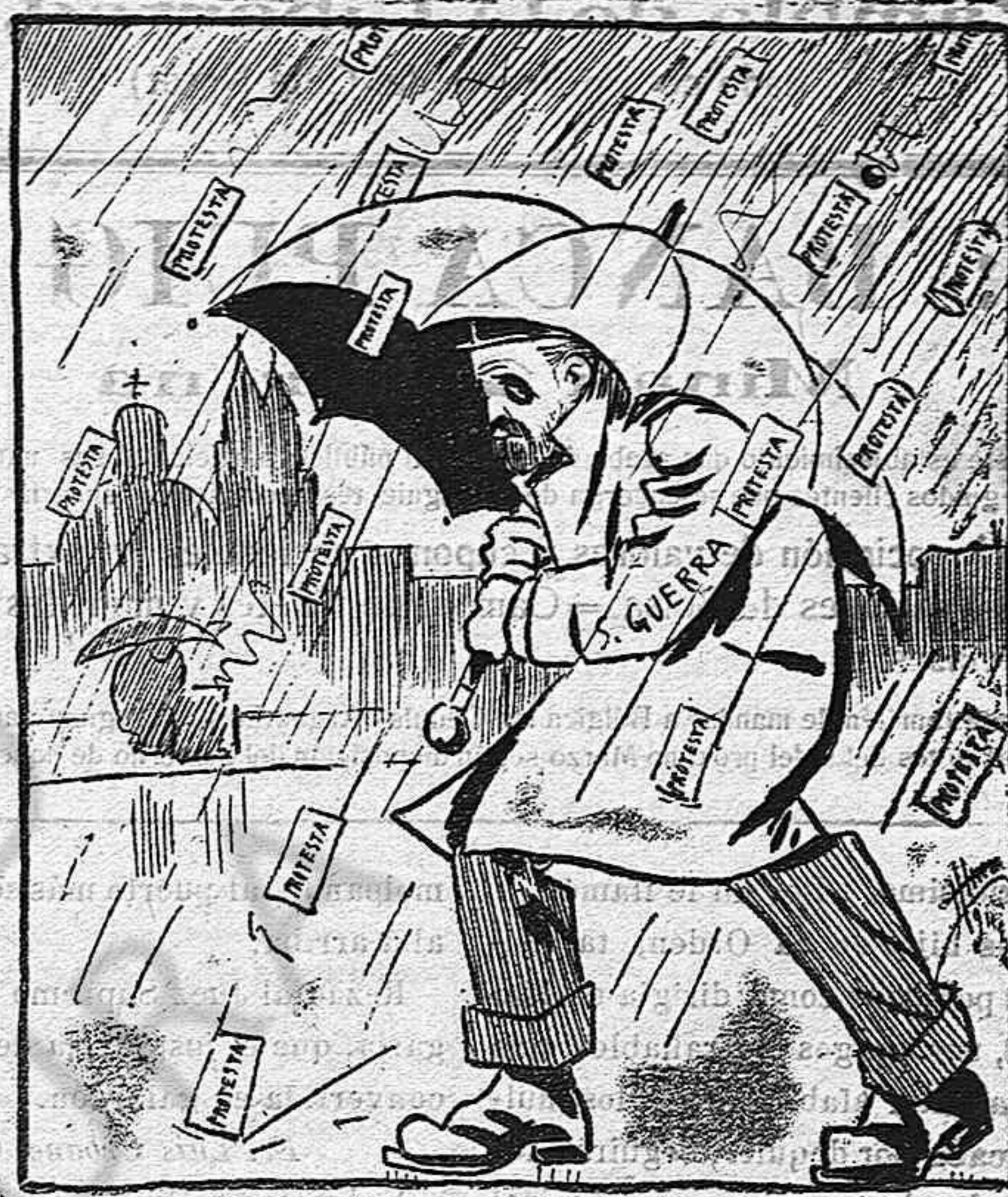
Sánchez Guerra.—El otro temporal ya ha «amainado» pero lo que es éste no lleva trazas de «amainar».

Yo recuerdo haber escuchado esos quejidos, yo vi esas lágrimas, yo contemplé esos crespones, yo