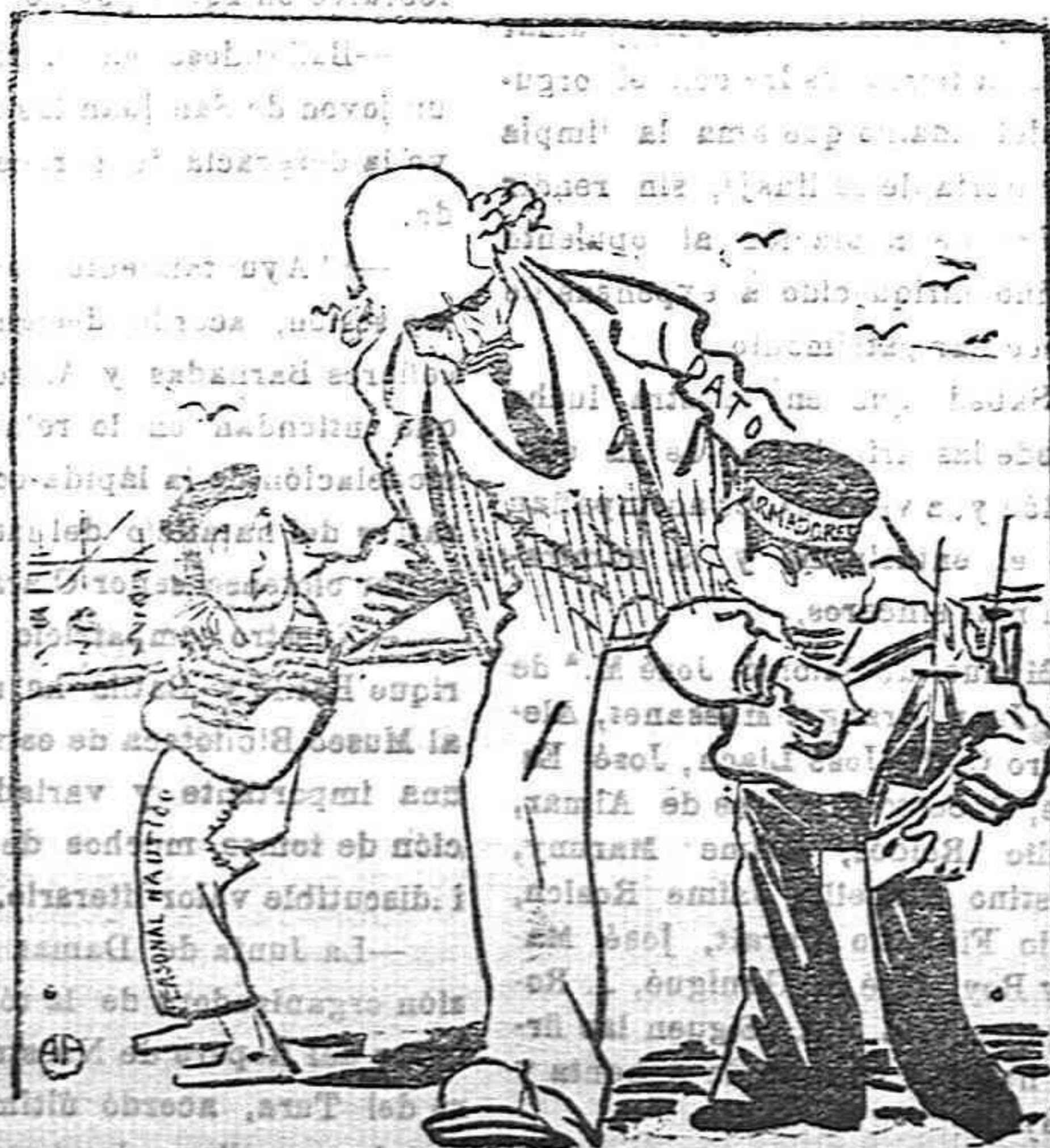
Dato.—Prometerme que seré amigos.