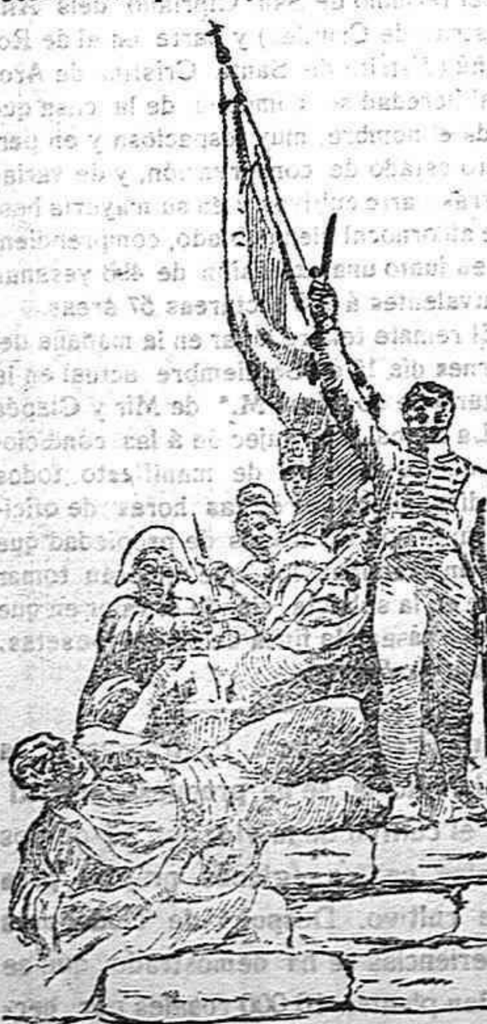
Grupo que corona el monumento

Representa el monumento el arco por que fué cortado el puente de San Payo para detener el avance de las huestes de Napoleón, sirviéndole abrup-