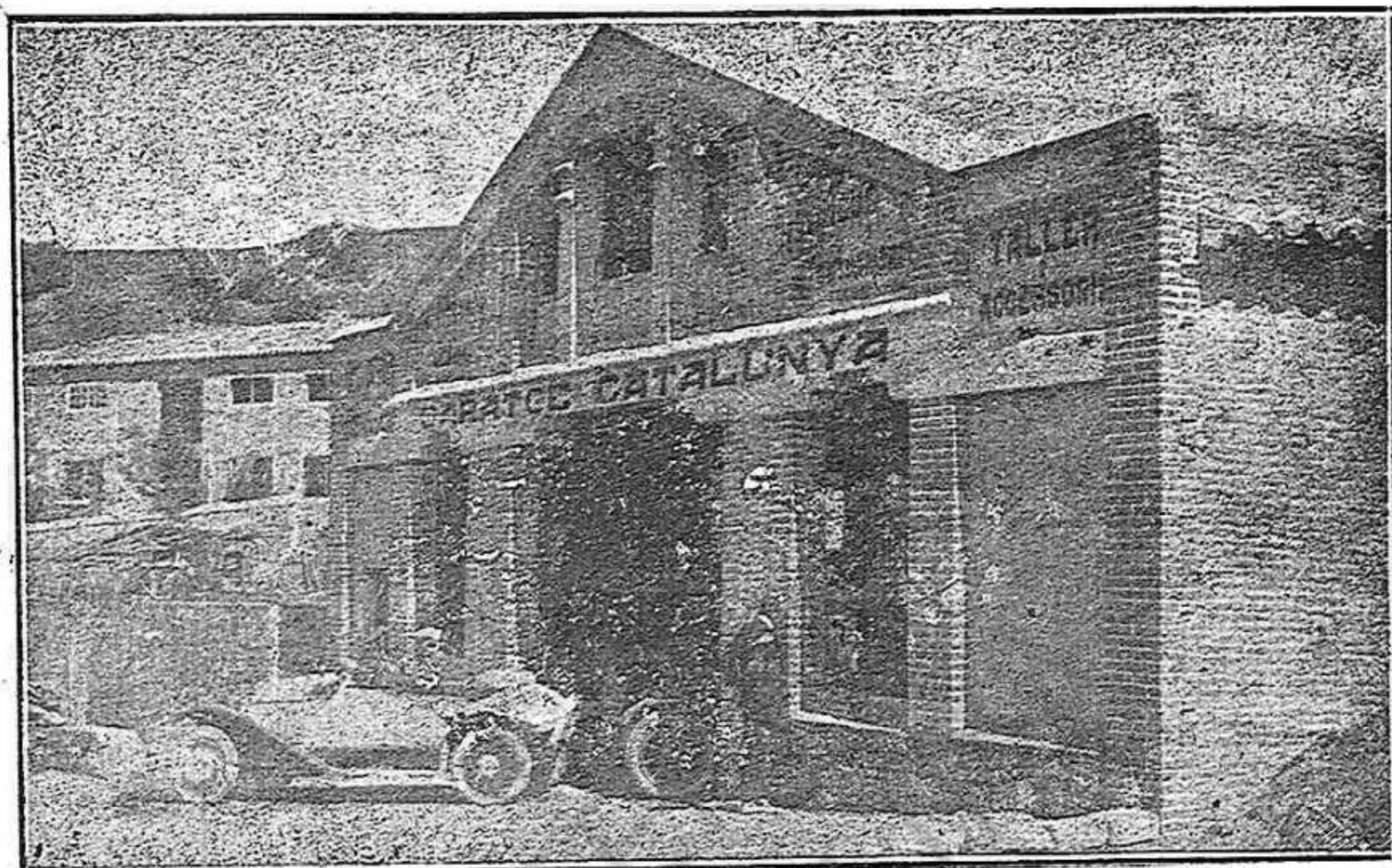
Gran garage, que acaba de inaugurarse a Sant Hilari situat a la carretera de Vich, proxím a la Plassa del Doctor Grivolosa i de la nova Font del Sirer.