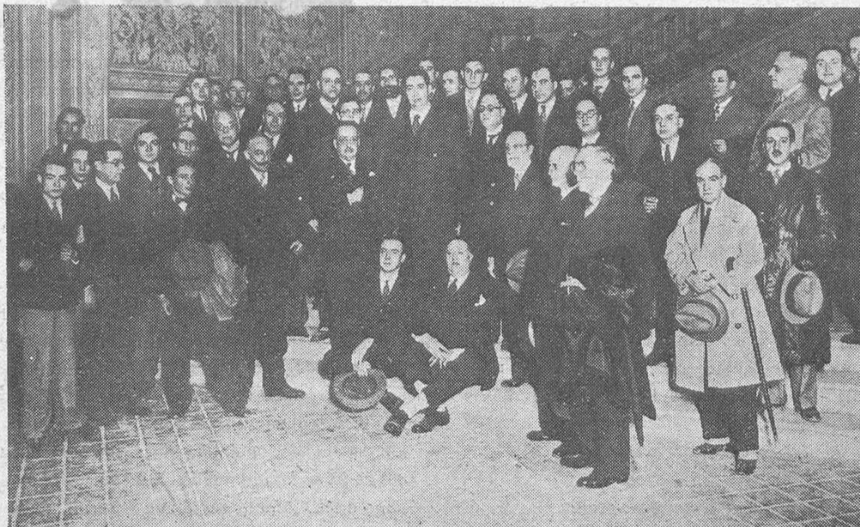
Los concurrentes a las Jornadas de Onda Corta de la Exposición de

Pocas disposiciones, como la reciente sobre estructuración agro-pecuaria, han pasado por tantas odiseas antes de salir a la Gaceta. Comisión redactora, sección respectiva de la Asamblea, pleno de ésta y por último puso en ella sus beneficiosas manos el Jefe del Gobierno. Menos mal que según opinan los enterados en cada una de estas