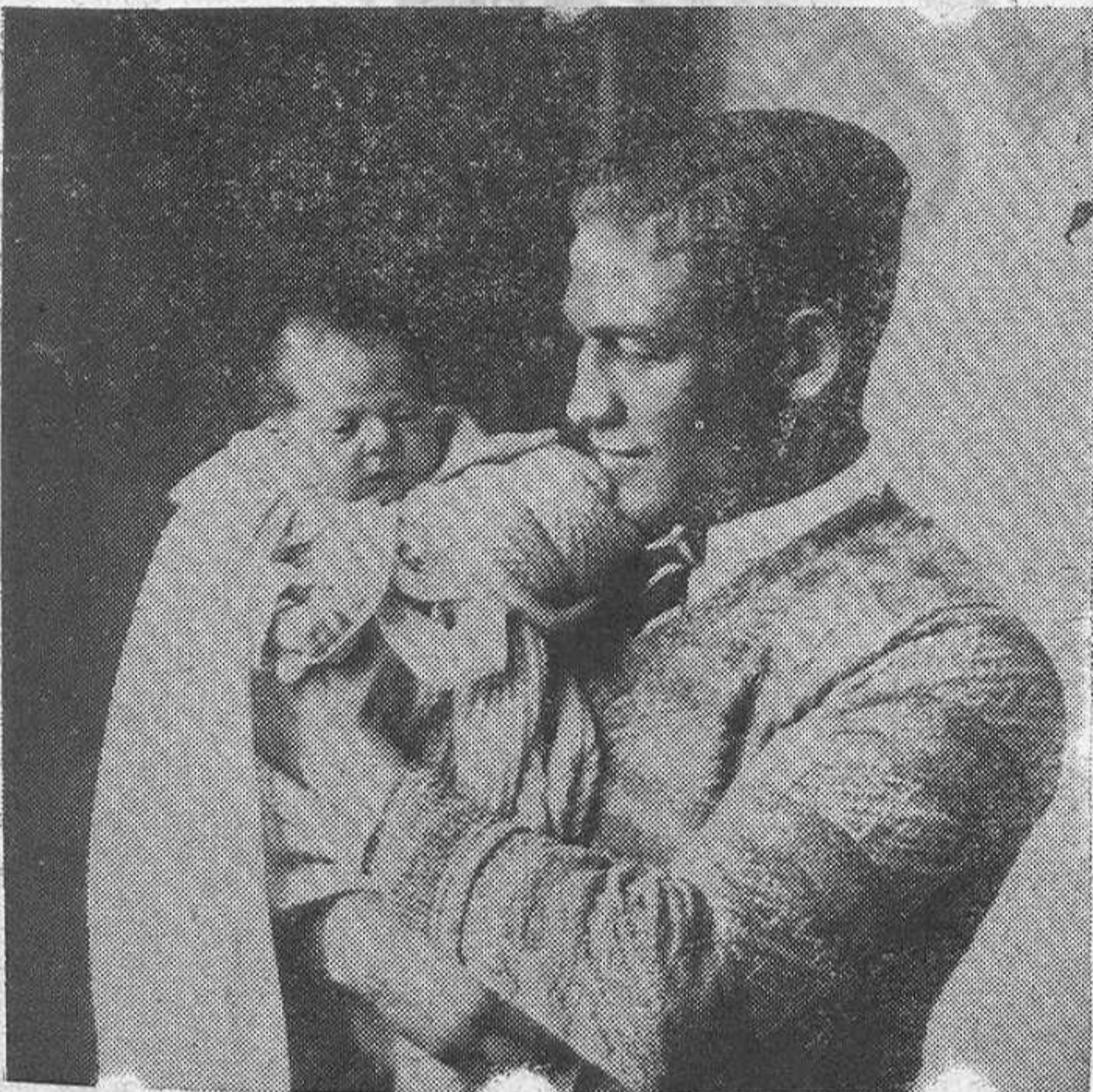
Gironés, campeón de Europa, peso pluma

«Ayer por la mañana una y otra personalidad estuvieron en contacto, casi físico, casi cutáneo, con los grupos supervivientes de la banda terrorista que asolaron el panorama urbano de España. Pasearían por una calle donde apenas si se oye hablar otro idioma que el castellano, acaso atalayaran los «debits» rampando sobre el pavimento húmedo, cenagoso, sin urbanizar, delante y detrás de cuyos mostradores se fraguó cuando un bufo, aunque suculto y remunerado rodeo de la frontera, cuando un atentado a una personalidad o a un simple agente de la Policía o una infiltración alevosa en la gran ciudad. Es posible que también vieran repartir u oyeran vocear las hojas comunistas que en varios idiomas, incluso, naturalmente, en español, se enseñan contra los regimenes burgueses y glorifican las excelencias de la nueva Rusia. Pero, sobre todo, lo que acaso percibieran por muy rápida que fuera la excursión—una hora, de nueve a diez de la mañana duró aproximadamente—es la miseria ambulante. Miseria física, miseria moral.»