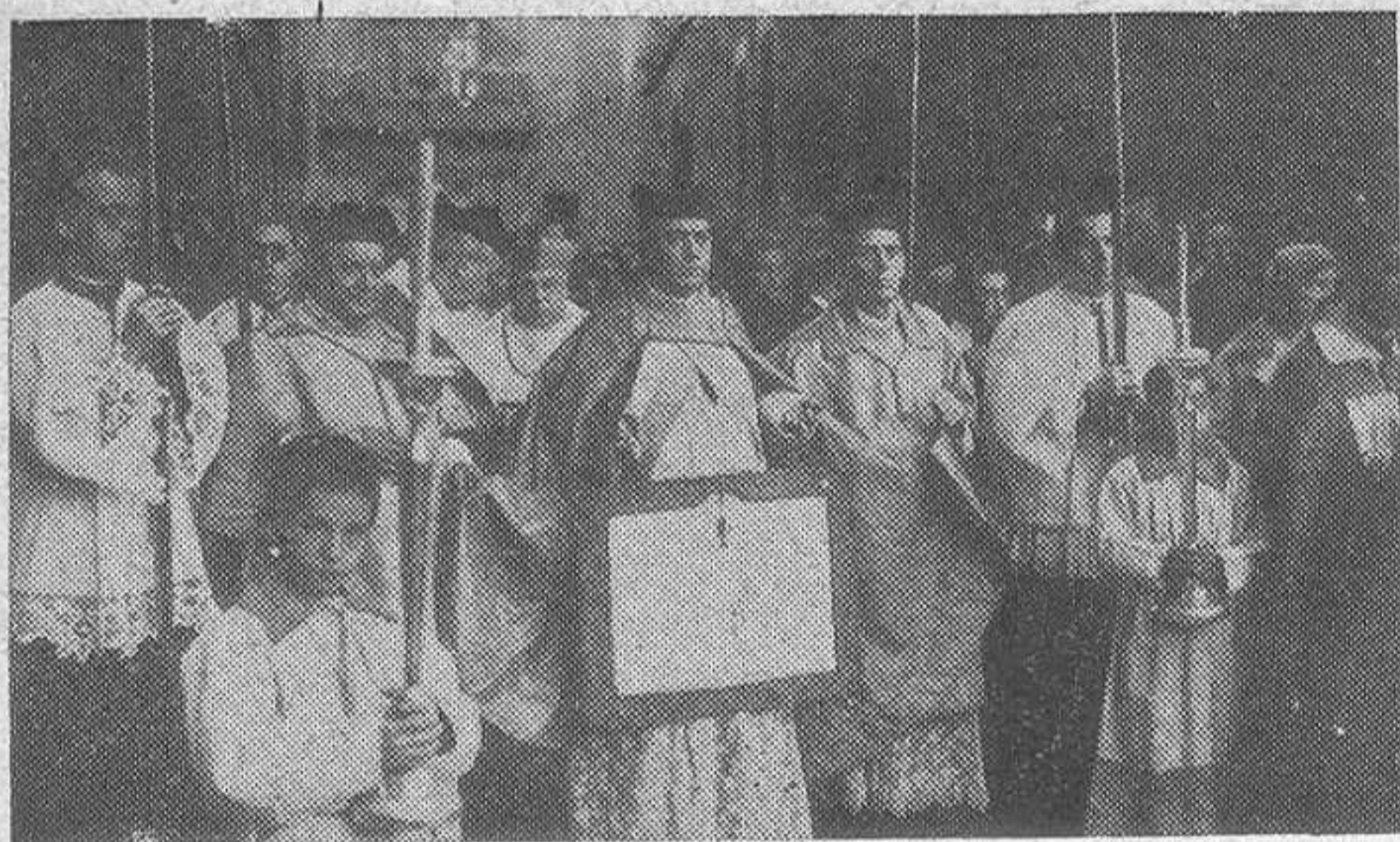
Barcelona - Publicación de la Santa Bula

profeta como un compendio de los Milagros con que el Mesías prometido ha de probar su divina misión y Jesucristo por toda respuesta a los enviados del Bautista no hace más que hacerles notar como en él tiene su cabal cumplimiento todo lo que Isaías había vaticinado. Jesucristo pues se declaraba a sí mismo verdadero Mesías y daba de ello una doble prueba; la prueba del milagro y la prueba de la profecía. El Bautista podía estar satisfecho: desde entonces aquellos sus discípulos que se obstinaban en tomarle a él por verdadero Mesías, a pesar de sus protestas, y que no podían disimular la envidia que sentían al ver los progresos de la predicación de Jesús no tendrían ya excusa; tendrían que reconocer que realmente Juan no era mas que Precursor y que el verdadero Mesías no era otro que Jesucristo. Para nosotros esta respuesta tiene el mismo valor que tenía para los discípulos del Bautista y aún más, pues hay que añadirle el valor que le da el testimonio de veinte siglos. Es una prueba de la Divinidad de Jesucristo que no admite réplica; para no verla es necesario estar obstinado en el error. Nosotros creemos la Divinidad de Jesucristo, pero nuestra conducta está siempre conforme con nuestra fe?