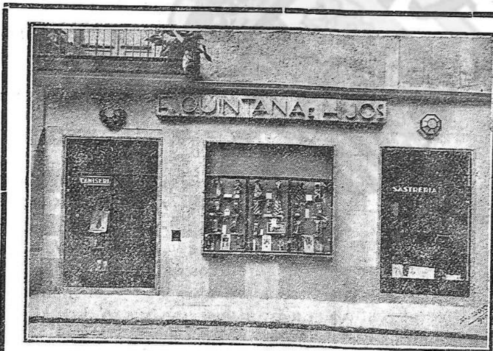
Plaça de les Castanyes - GIRONA

S'imposa accelerar una remoció total de gent que s'han distingit en els períodes d'abjecció dictatorial i monàrquica, si volem que el nou règim que tots apoiem, respongui a les exigències de l'opinió i al significat del capgirament d'un estat de coses nefast i anticuatà.