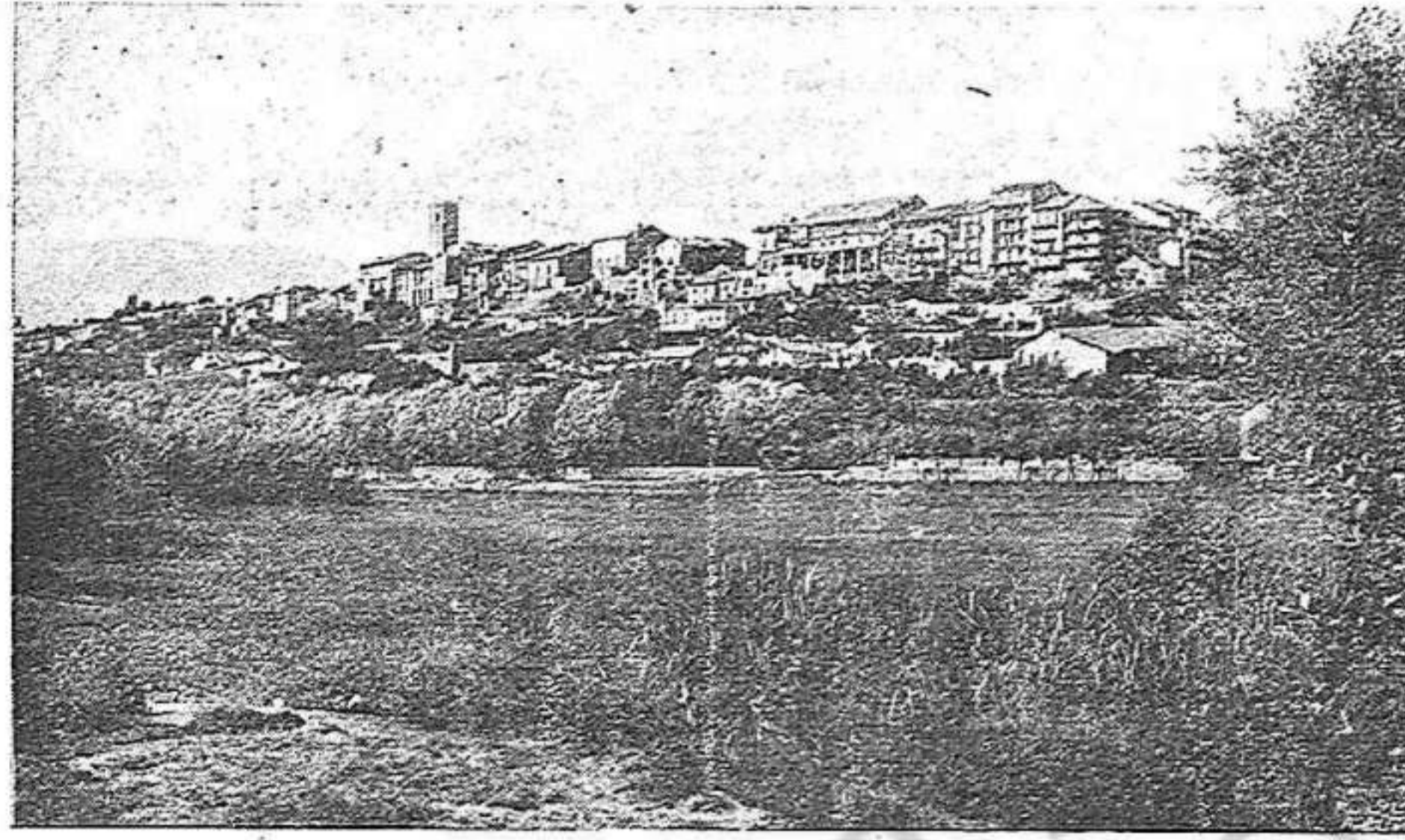
Una bonica Vista general de Puigcerdà