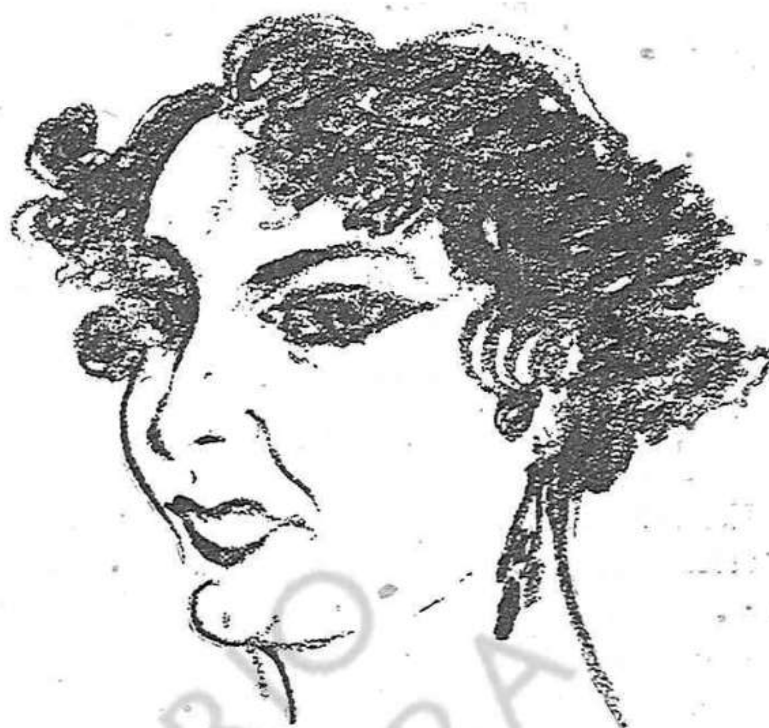
(Dibuix de Ll.)