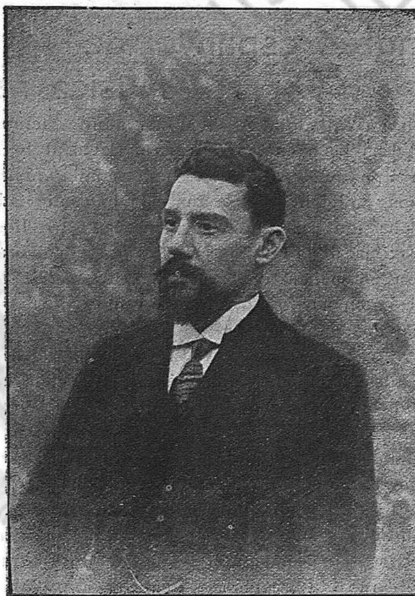
En Pere Rigau