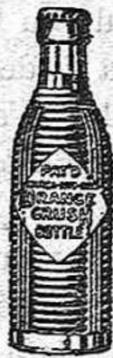
(Marca, botella y nombre registradas)

Esija siempre la botella original y rechace imitaciones.