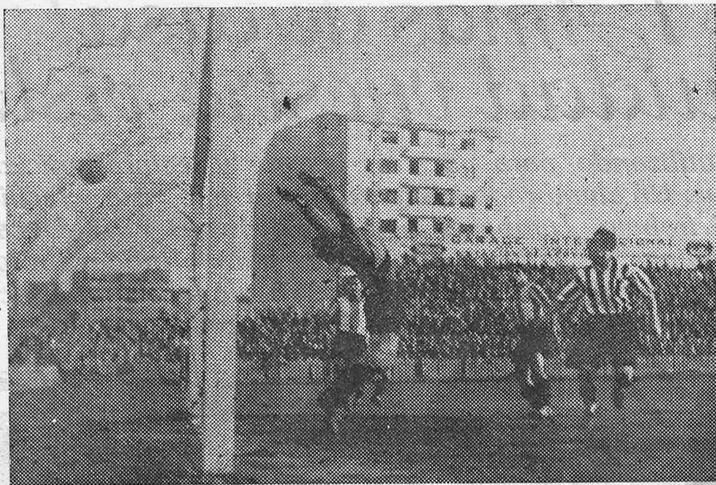
L'Atlètic de Bilbao vencé a l'Espanyol per cinc gols a dos. L'e esplèndid gol marcat per l'Internacional Iraragorri. Ma l'grat la formidable estirada de Fou rniés, la pilota va a les malles. ....