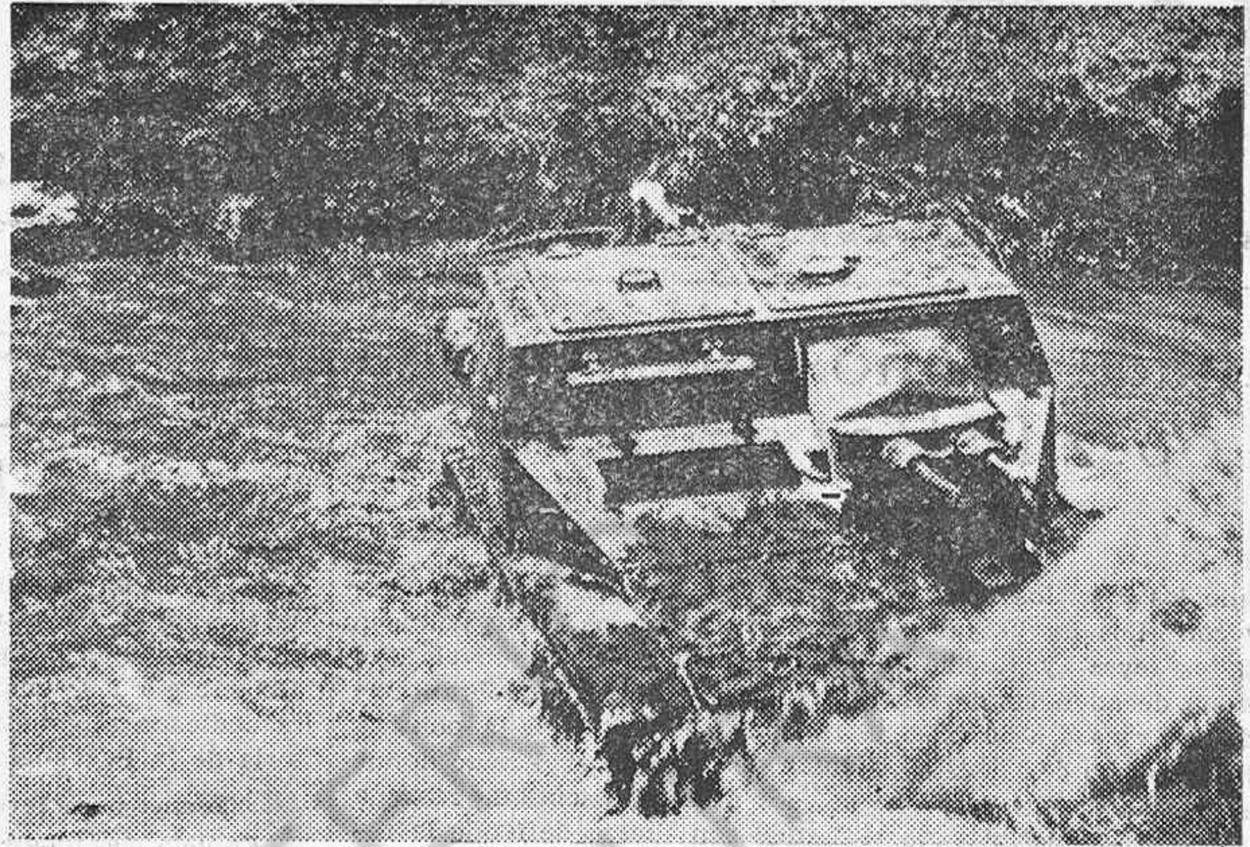
Tanque italiano atravesando el río Errer, durante el avance hacia Harrar, apuntando una sección de abisinios escondidos entre los matorrales del otro lado del río.