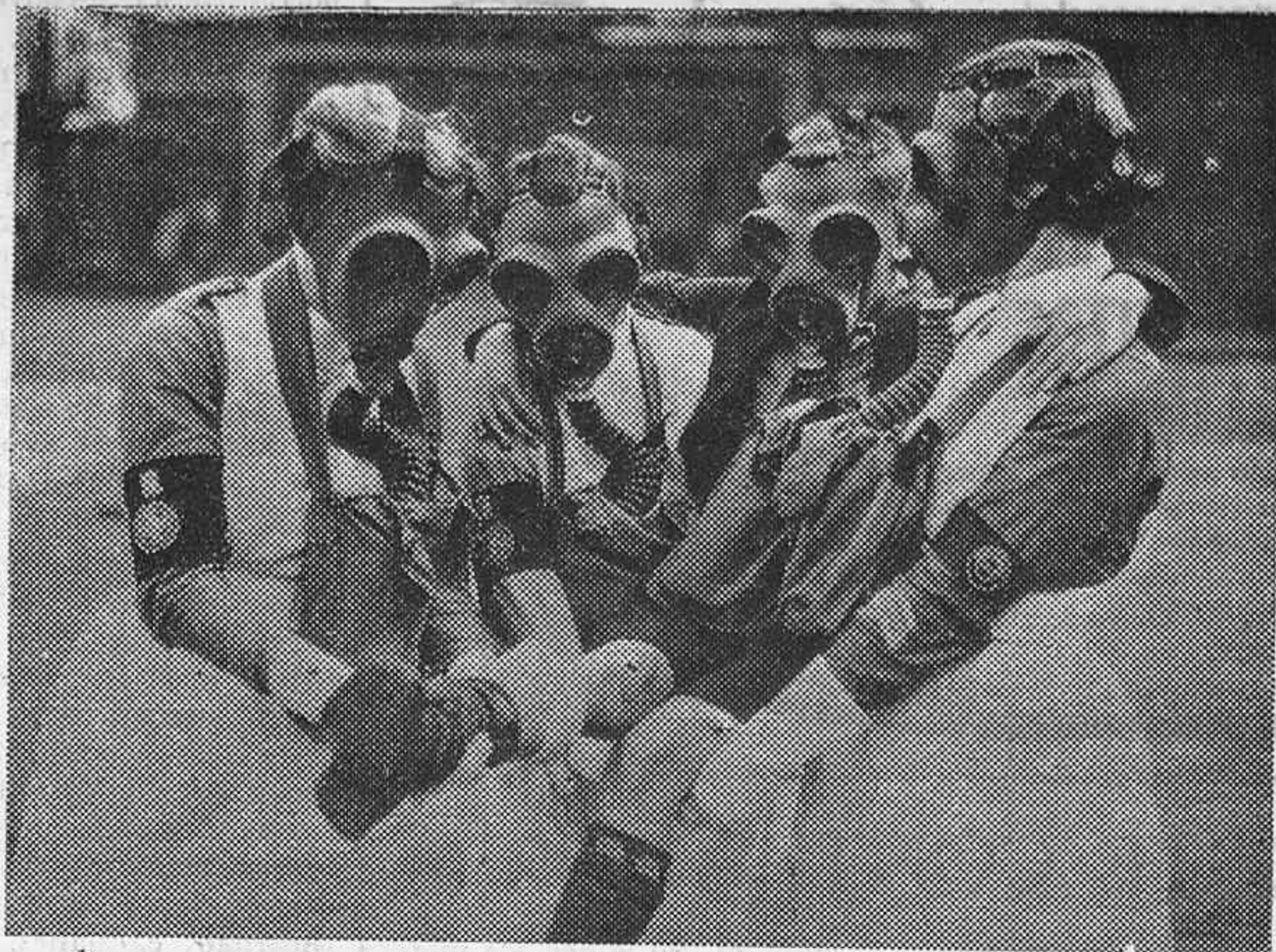
A los habitantes de Londres se les ha hecho uno de estos últimos días una demostración de cómo deben comportarse en caso de un ataque de gas aéreo. La brigada de asistencia social de Londres entrenó a siete mil hombres y mujeres referente a los ejercicios de salvación. Durante una demostración.