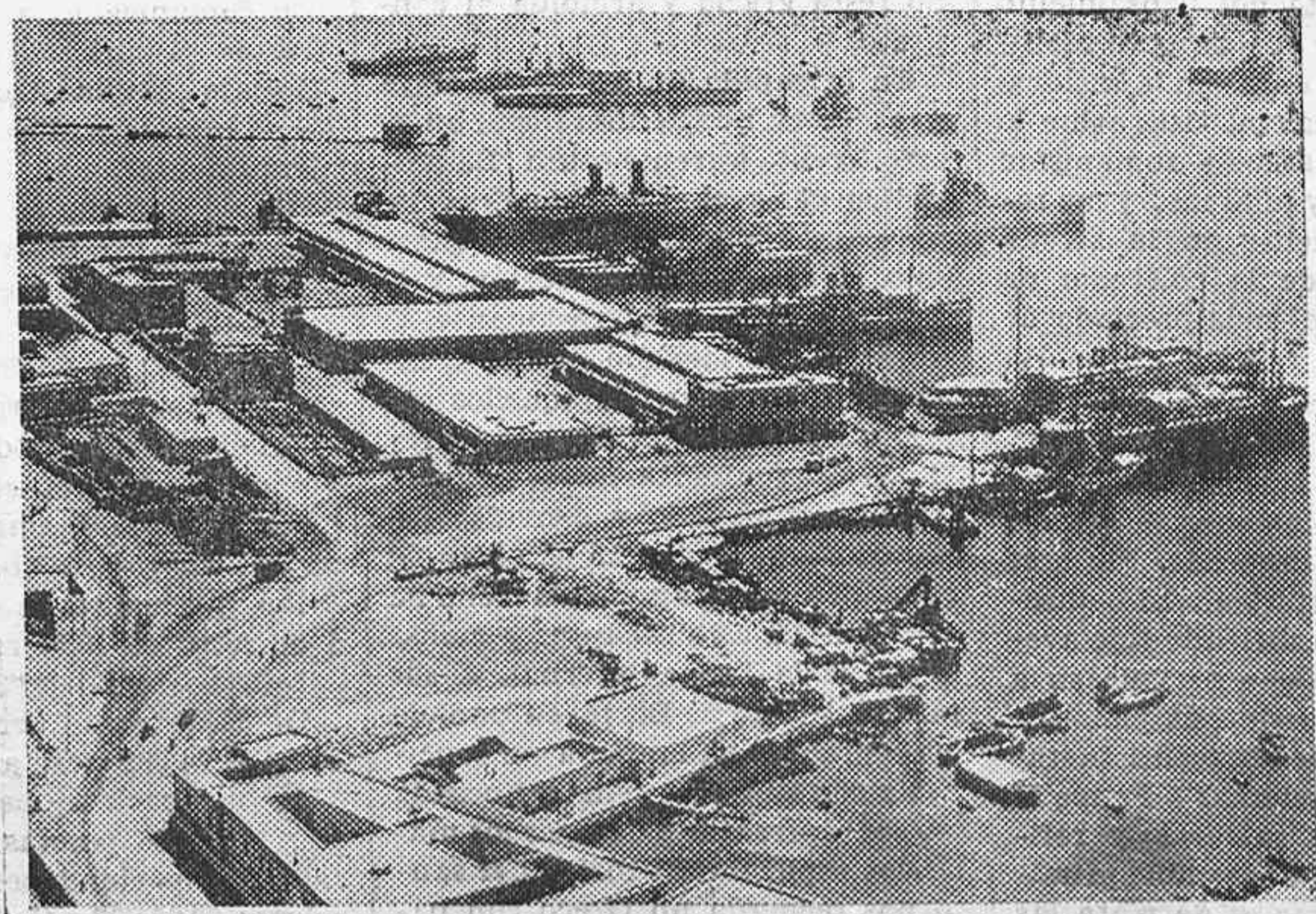
En vista de las posibilidades de una próxima guerra, Italia ha engrandecido el puerto de Trípolis y ha reforzado las fortificaciones. Vista del puerto de Trípolis con la escuadra italiana reforzada.