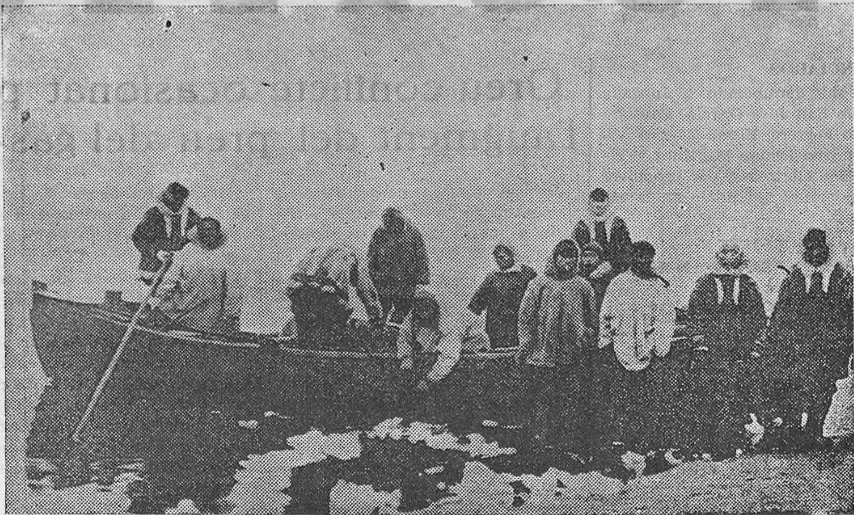
Bote bollerero en el cual fueron trasladados los restos de Wiley Post y Will Rogers desde el lugar donde cayó el avión en el cual viajaban hasta Point Barrow, Alaska. Eskimales que encontraron los restos de las dos víctimas y fueron los primeros en comunicar la noticia. Express-Foto.)