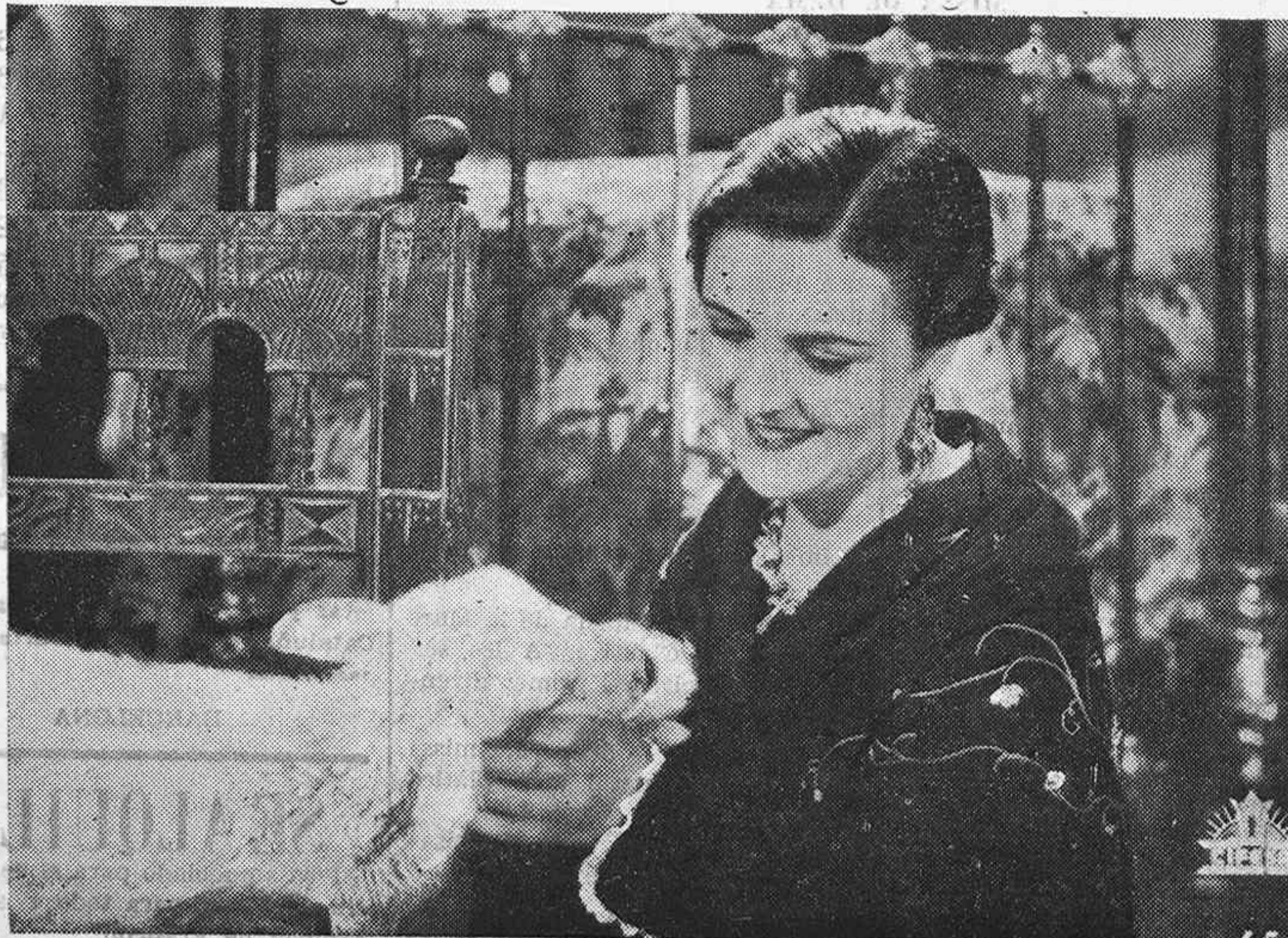
Imperio Argentina, popular "estrella" de la pantalla y protagonista del nuevo film nacional de CIFESA "NOBLEZA BATURRA".

"Romance de estudiantes" bello poema en color y encanto, al que sirve de fondo una música deliciosa y melódica, interpretado por Gre-