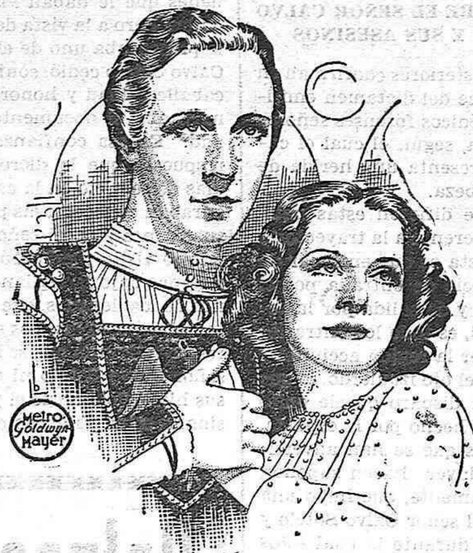
Norma Shearer y Leslie Howard, intérpretes de "Romeo y Julieta", de M. G. M.