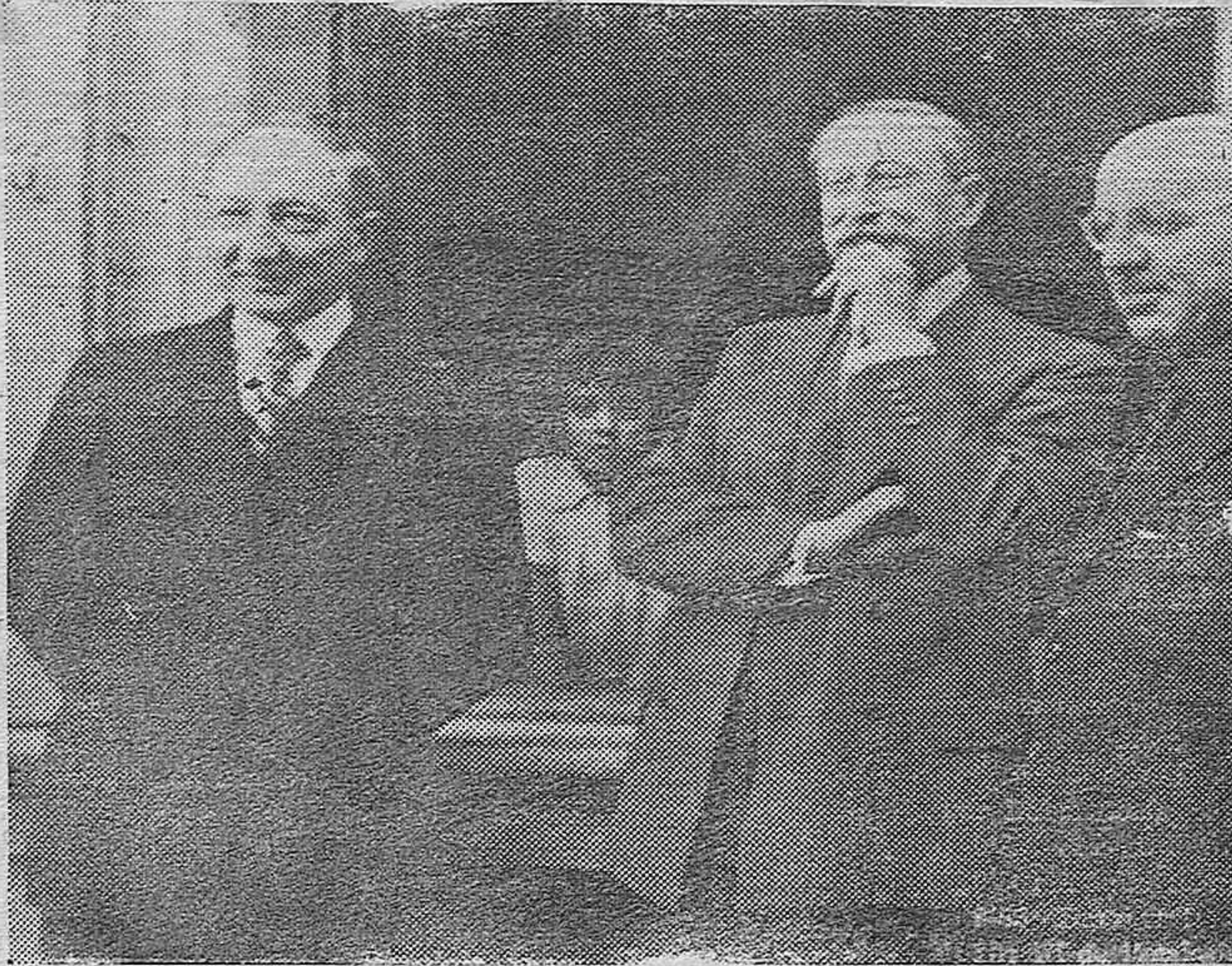
El señor Avenol, secretario general de la Liga de Naciones ha invitado a los señores Delbos y Blum a su casa para charlar durante los descansos de las sesiones de la Sociedad de Naciones. De izquierda a derecha, los señores Delbos, Blum y Avenol.

ENTRE SESION Y SESION DE LA SOCIEDAD DE NACIONES (GINEBRA)