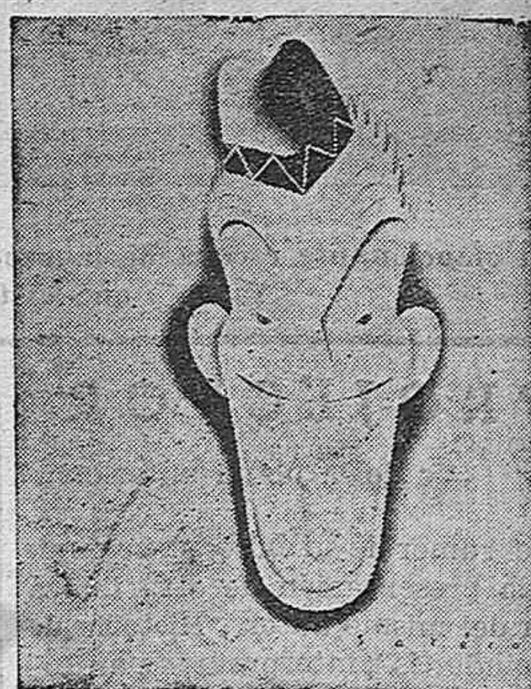
Oliver Hardy i Stan Laurel, los graciosos cómicos de M. G. M.