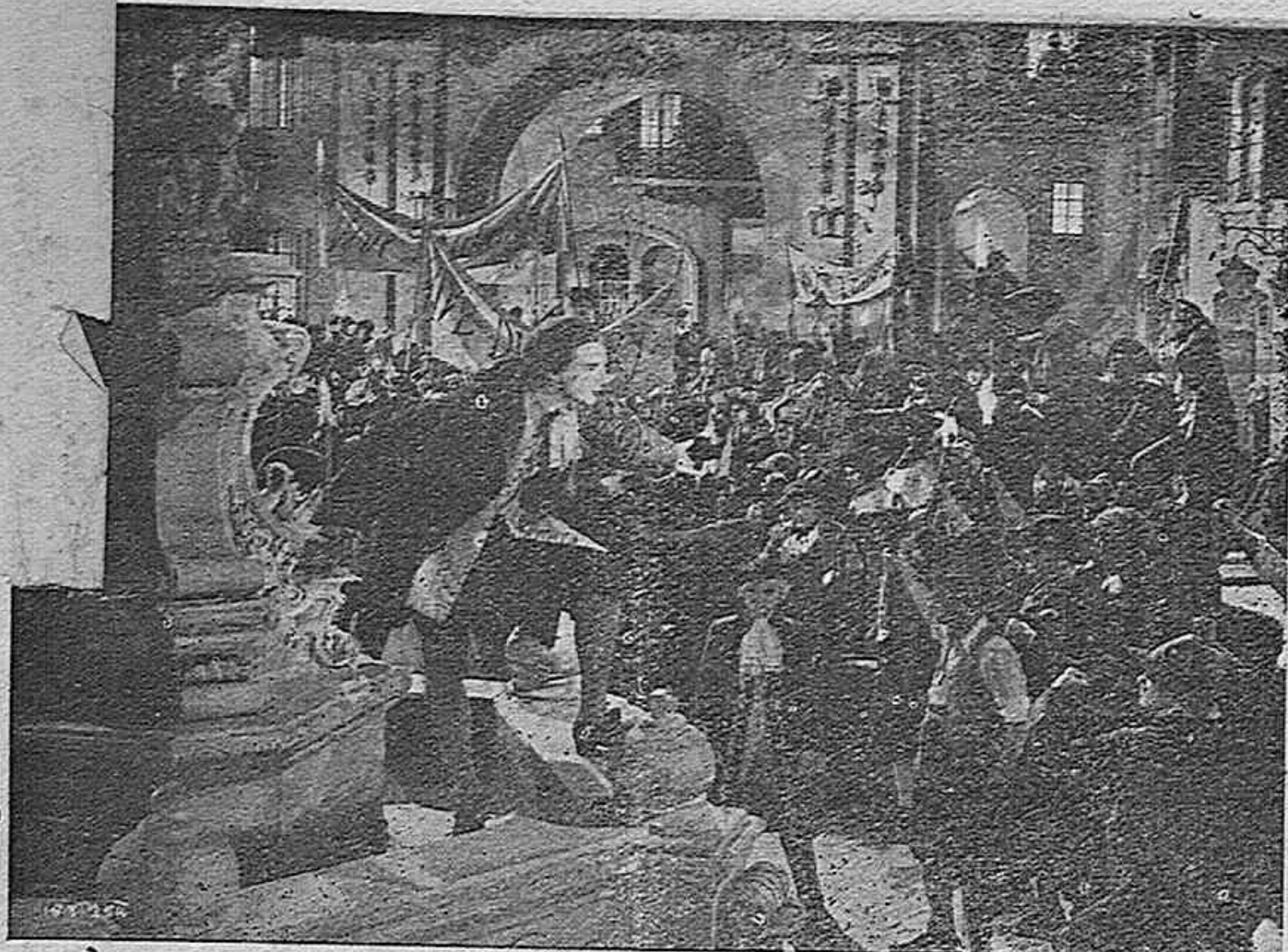
Una emocionante escena de la producción B. I. P., "Yo te doy mi corazón", que distribuye "Cifesa".