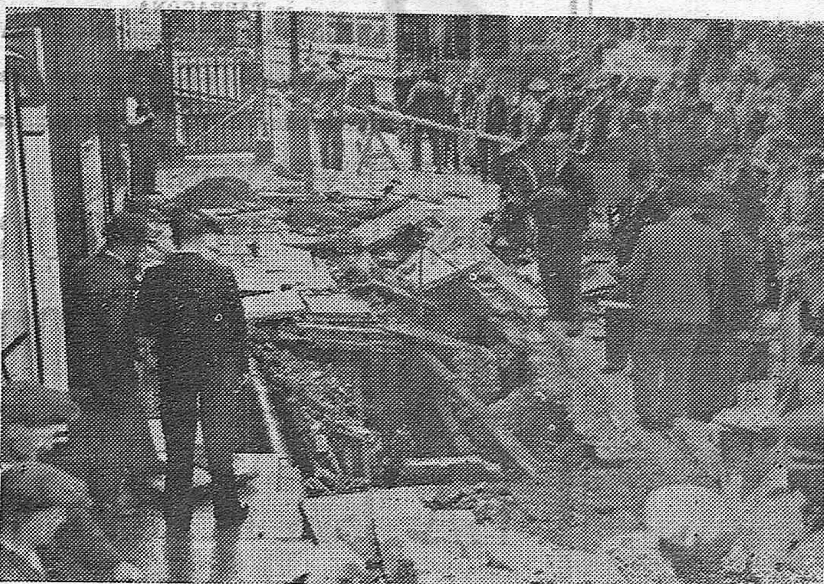
Cuando mayor era el tránsito en una de las principales calles de Londres, por causas desconocidas hizo explosión una gran cañería de agua, tirando grandes torrentes de agua por la calle, impidiendo el tránsito por la misma durante varias horas. Vista de los destrozos por la explosión de la cañería.