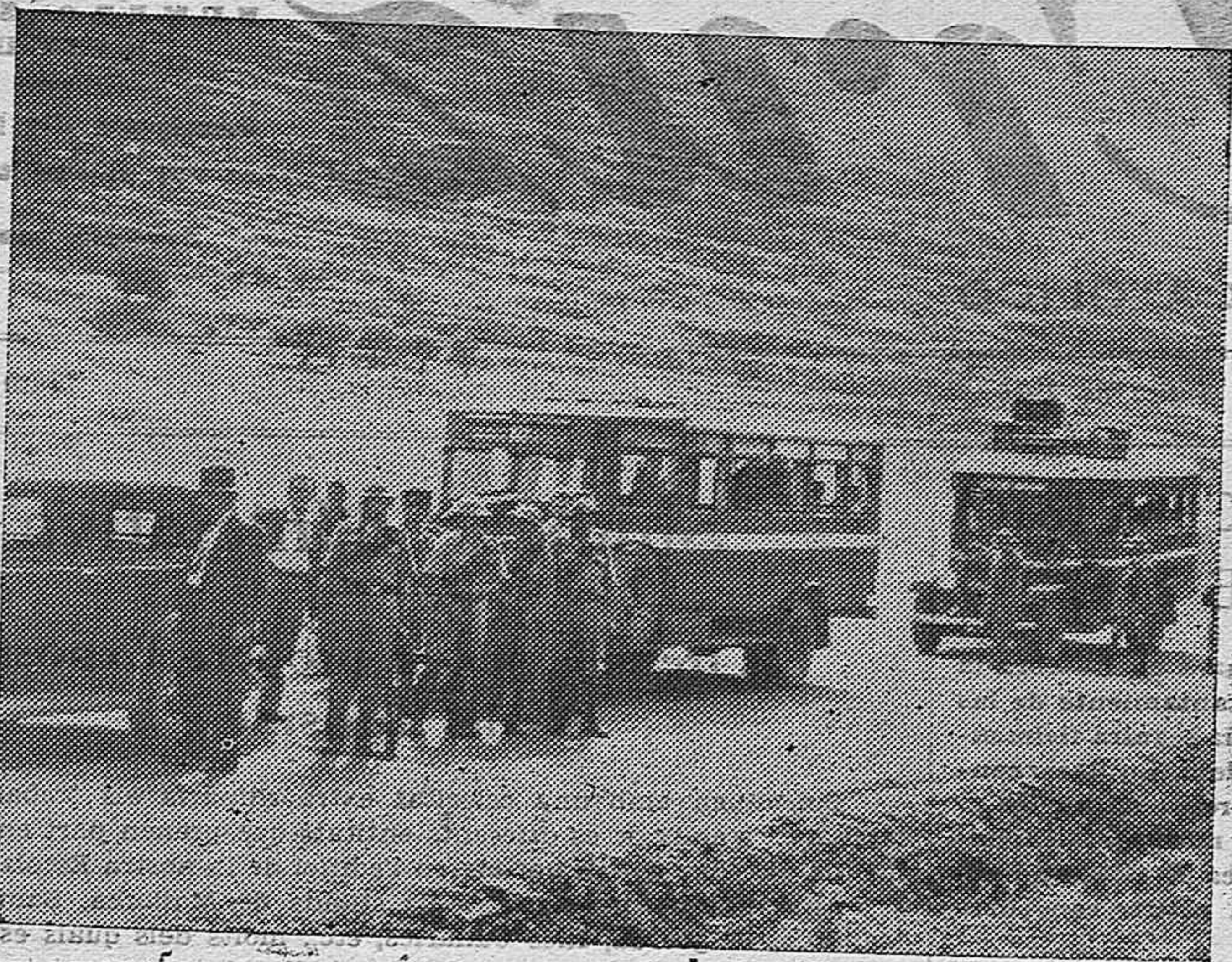
La situación de Palestina, es diariamente más grave. En Jaffa, los manifestantes han atacado a las tropas inglesas. Una caravana de judíos, rodeada de soldados ingleses, para evi tar cualquier tentativa de manifestación.