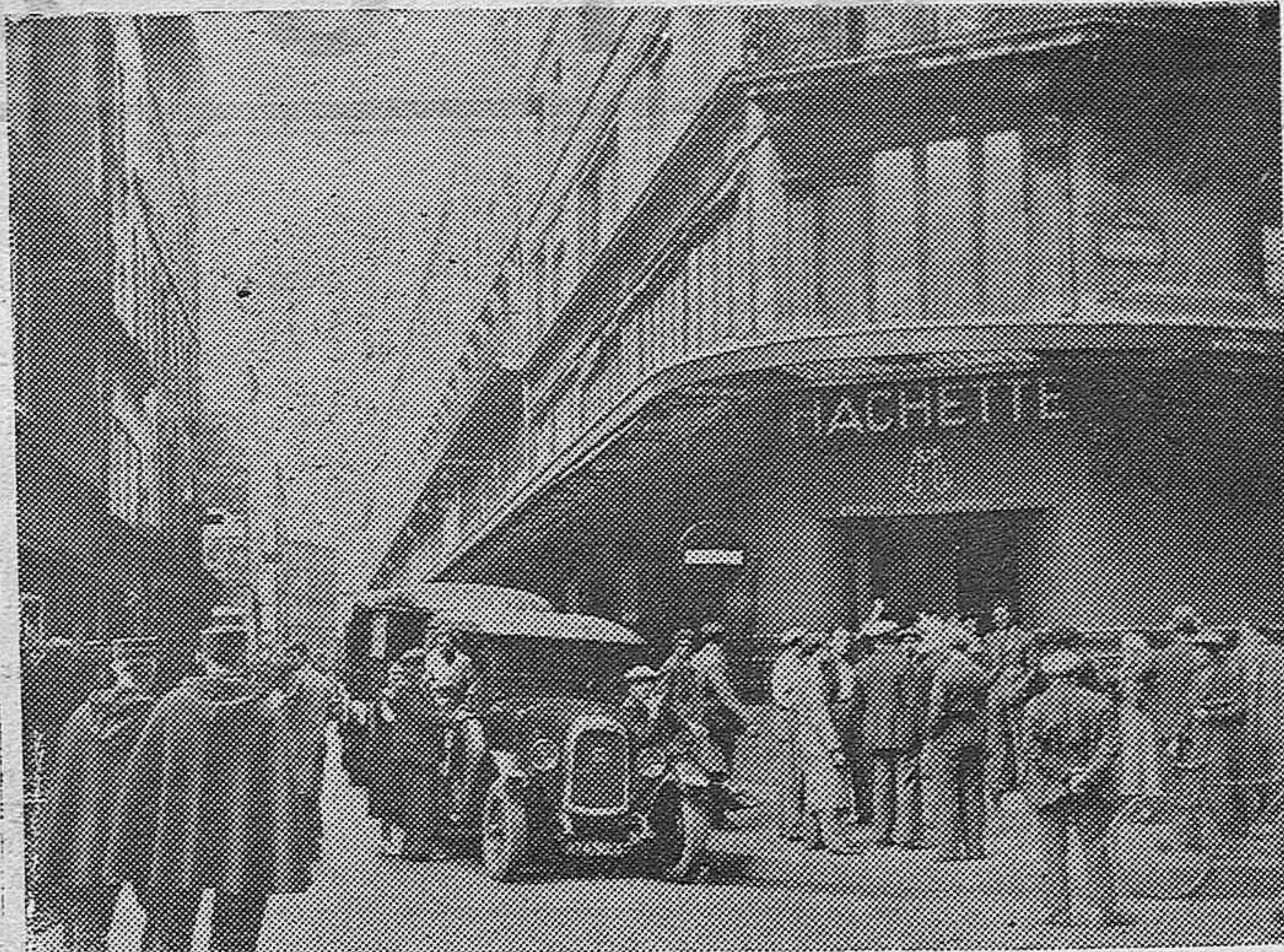
Los parisienses se han visto sorprendidos con la desagradable noticia que los empleados repartidores de la casa "Hachette", importante empresa francesa de repartos de periódicos y revistas al mismo tiempo que editorial se habían declarado en huelga, y por lo tanto se veían privados del placer de leer los periódicos. Los empleados de la casa "Hachette", ante el establecimiento comentando la huelga.