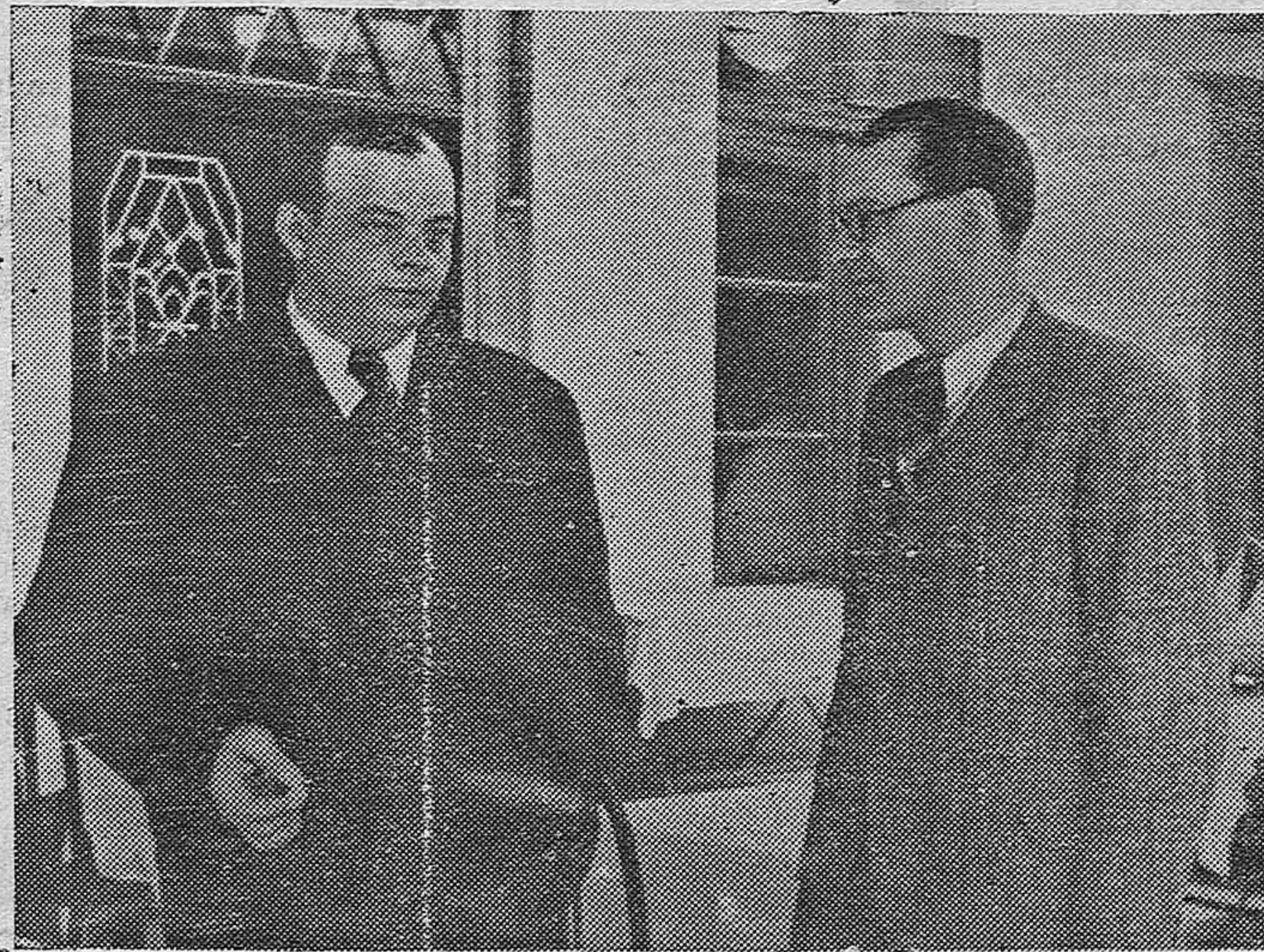
El célebre aviador Saint-Exupery, ha sido recibido en Bucarest donde ha celebrado una conferencia ante las principales personalidades rumanas. Saint-Exupery en el Aéreo-Club de Bucarest.