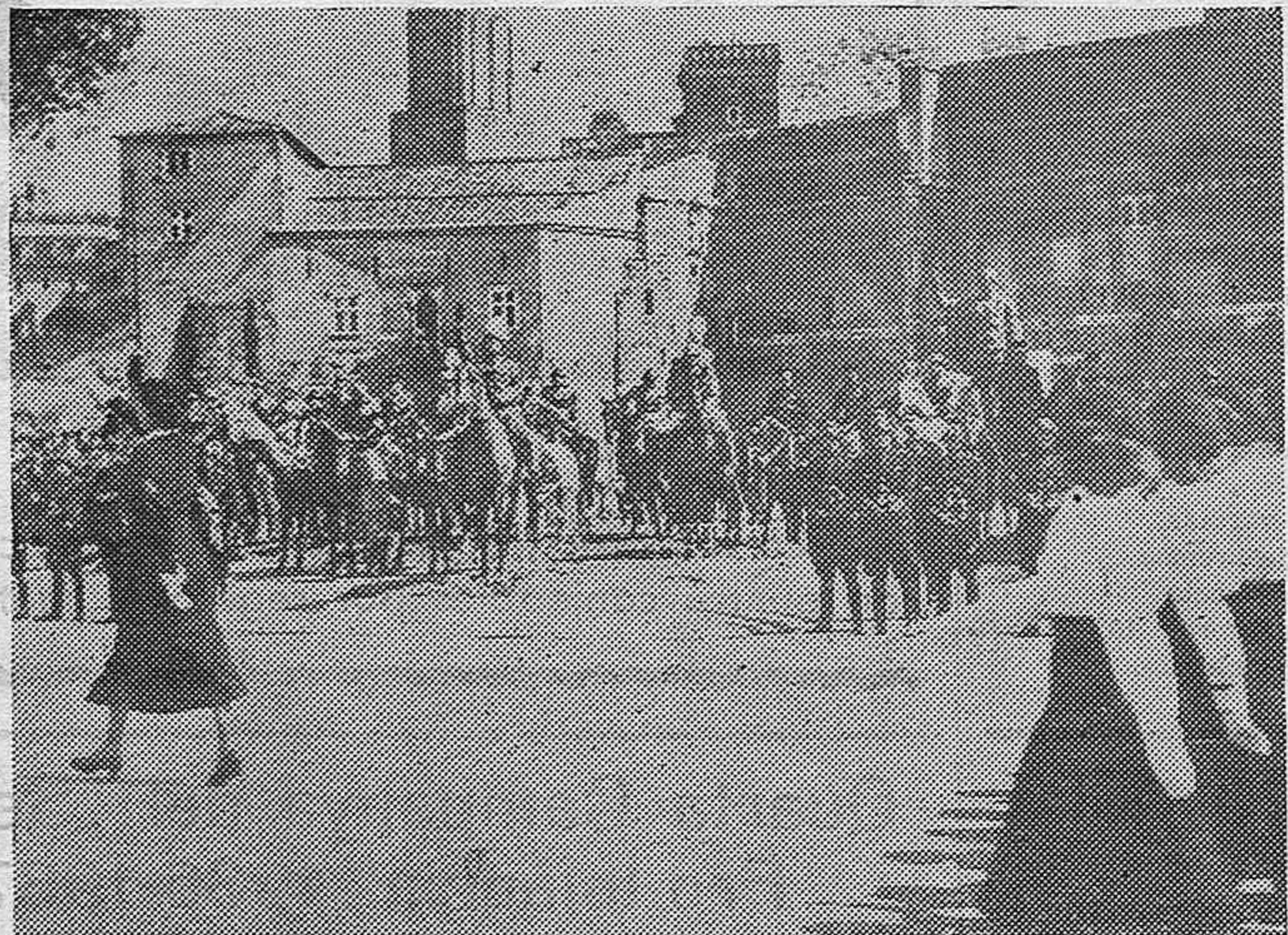
El día 24 del corriente se celebraron varios actos en Roma, par a conmemorar el 21 aniversario de la entrada de Roma, en la Gran Guerra 1914-1918, como aliada de Francia e Inglaterra. -- Desfile de las juventudes italianas ante el "Duce".