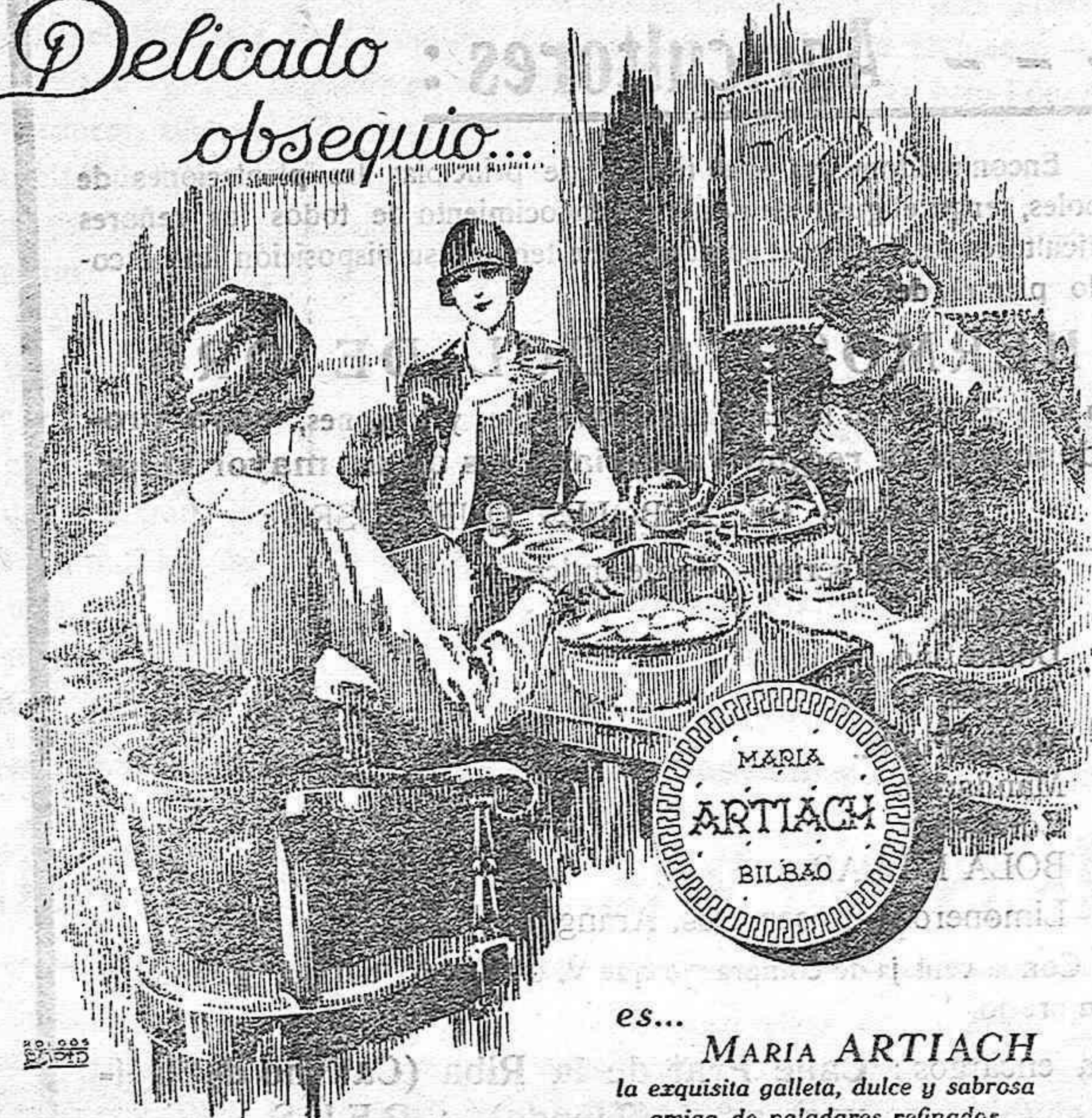
es... MARIA ARTIACH la exquisita galleta, dulce y sabrosa amiga de paladares refinados.

Desayuno ideal, postre exquisito, complemento indispensable de una buena comida, la auténtica MARIA ARTIACH la galleta por excelencia, está en todas las mesas, a todas horas.