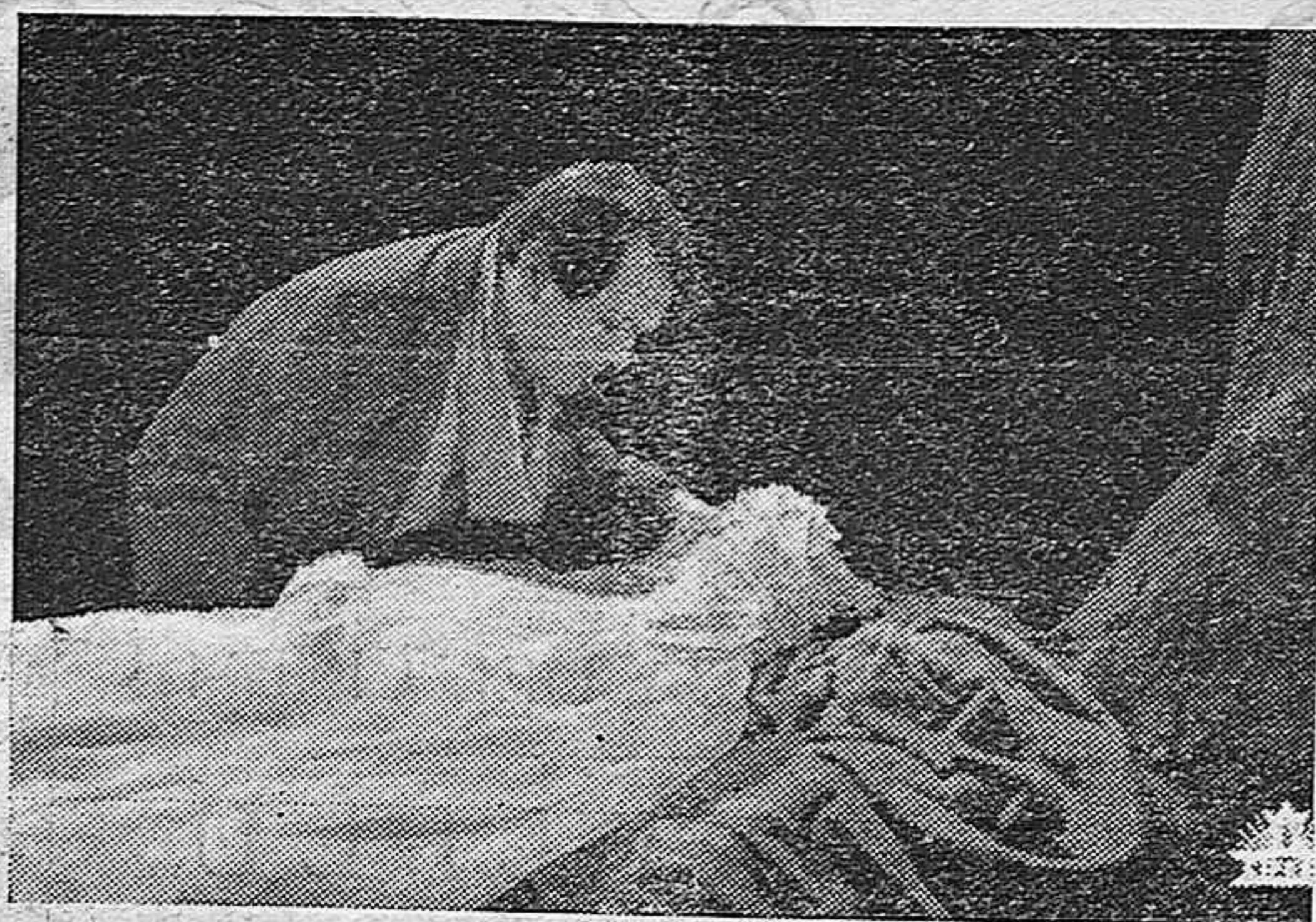
Una emocionante escena de la película española de "Cifesa", "El Gato Montés", adaptada según la popular ópera de Penella