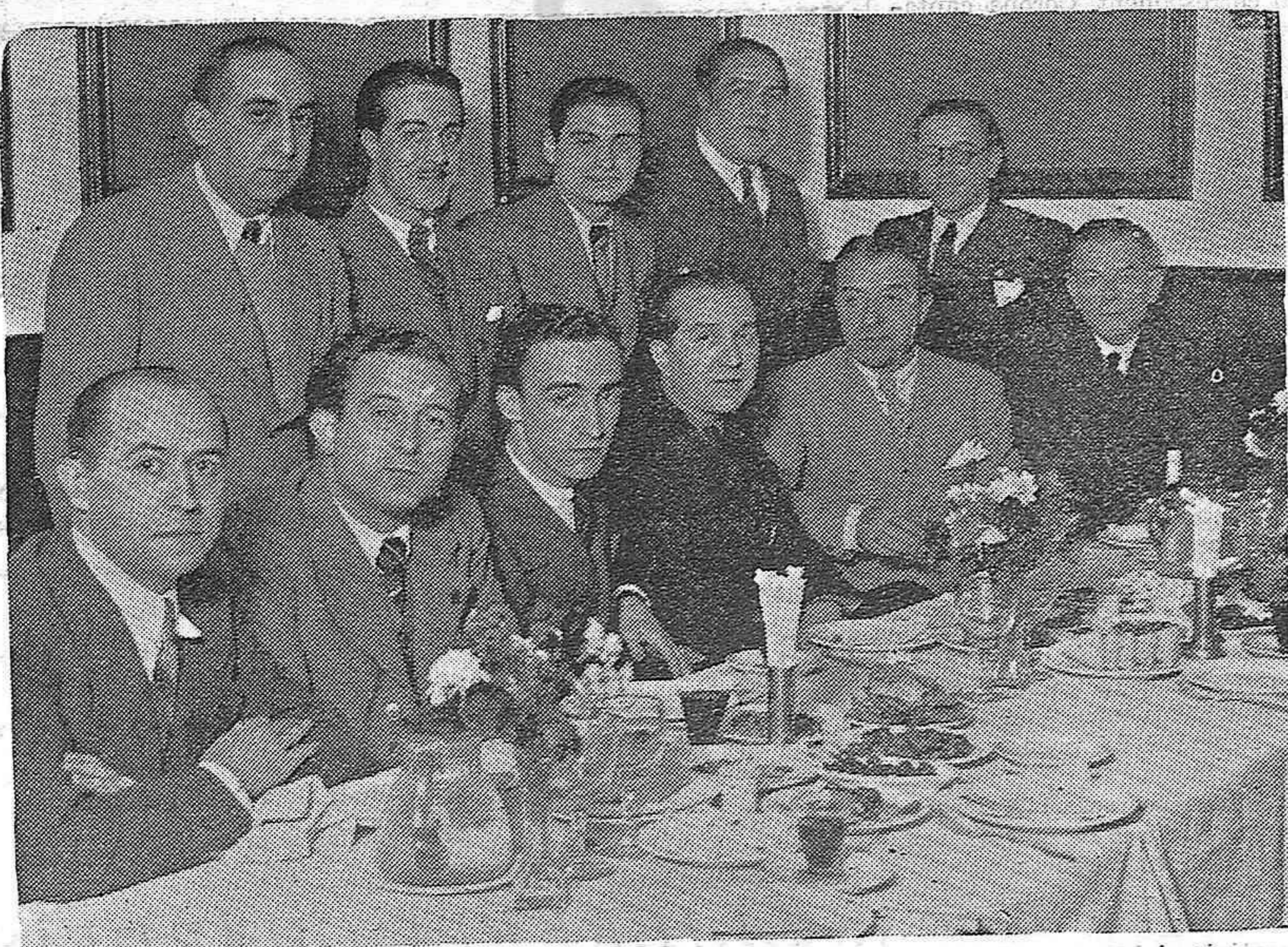
El popular actor de la pantalla, Miguel Ligero, obsequiado en Valencia.