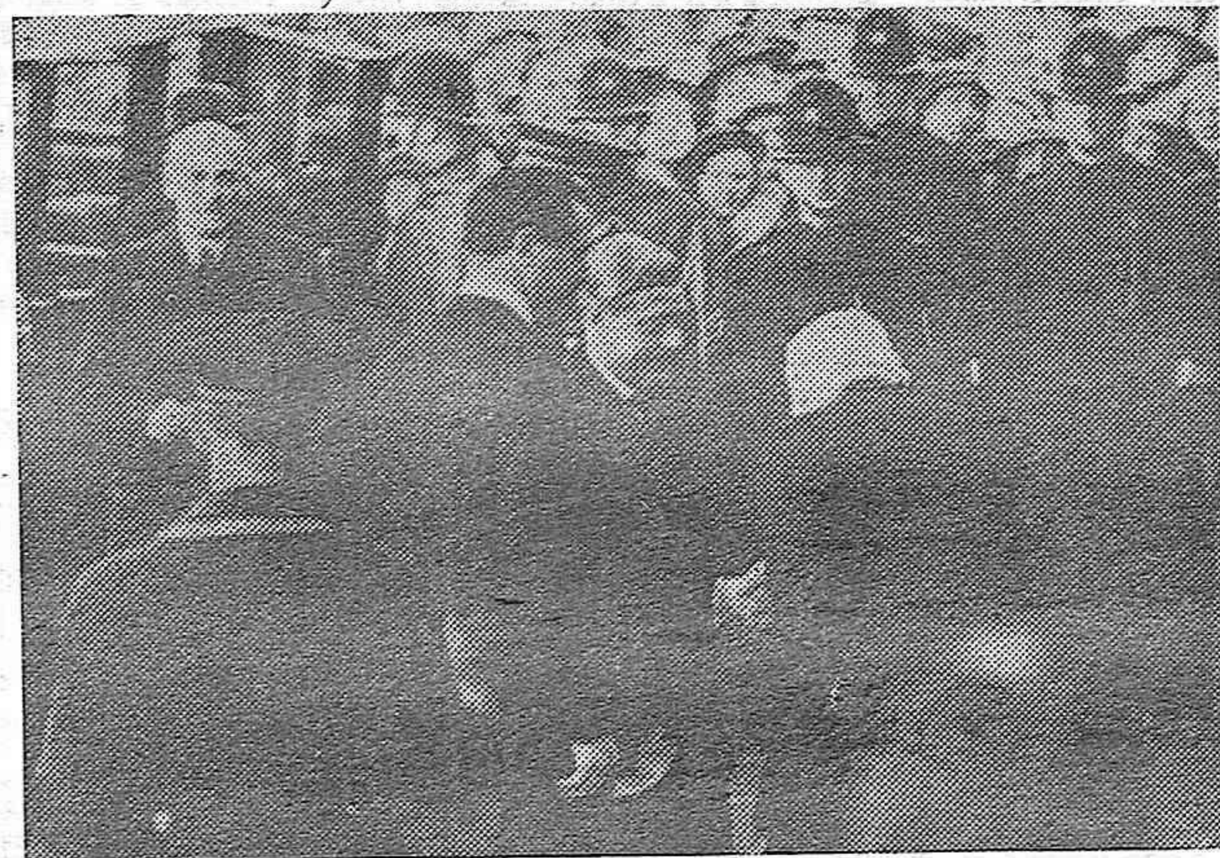
El Rey de Inglaterra Eduar do VIII, ha inaugurado la feria de muestras anual de la Gran Bretaña en Londres. Al llegar a la exposición el Rey fué salu dado per el presidente de Feria y la s autoridades. Llegada del Rey a la Feria.