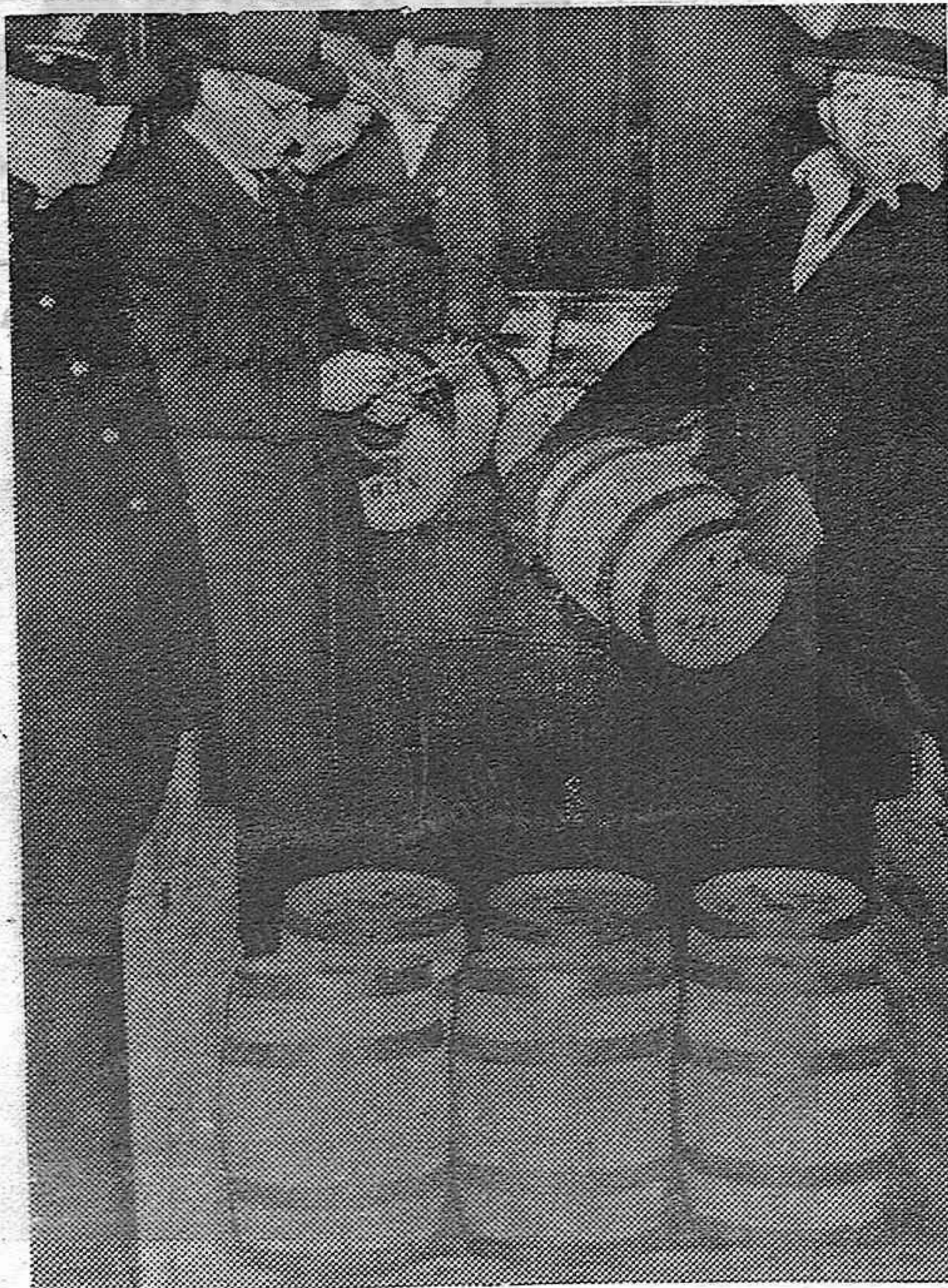
Ciento catorce barriles de oro por valor de Lb. 2.100.000 salen de Nueva York con destino a Inglaterra y Francia. Es el primer oro que sale de los Estados Unidos desde el año 1934.