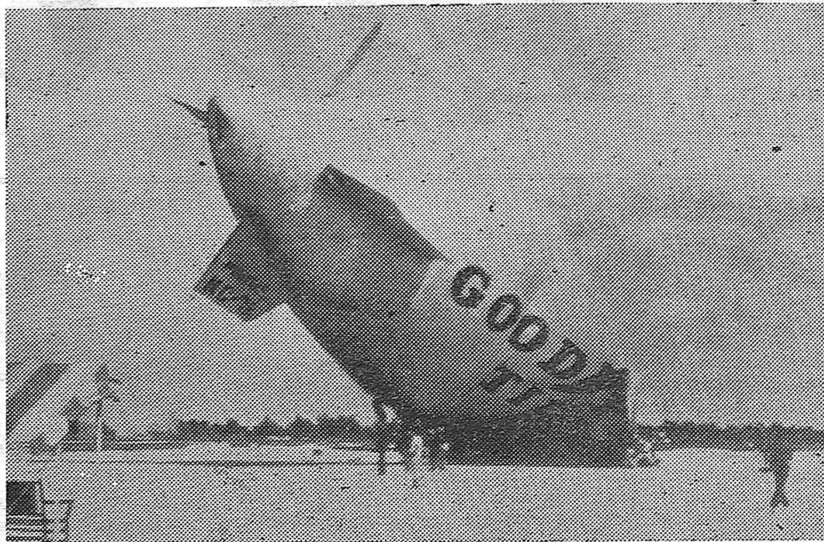
A causa de un incendio declarado a bordo del "Puritan" durante su viaje a Florida, se vió precisado a aterrizar. Resultando afortunadamente ilesos sus seis pasajeros. -- El "Puritan" después del siniestro.