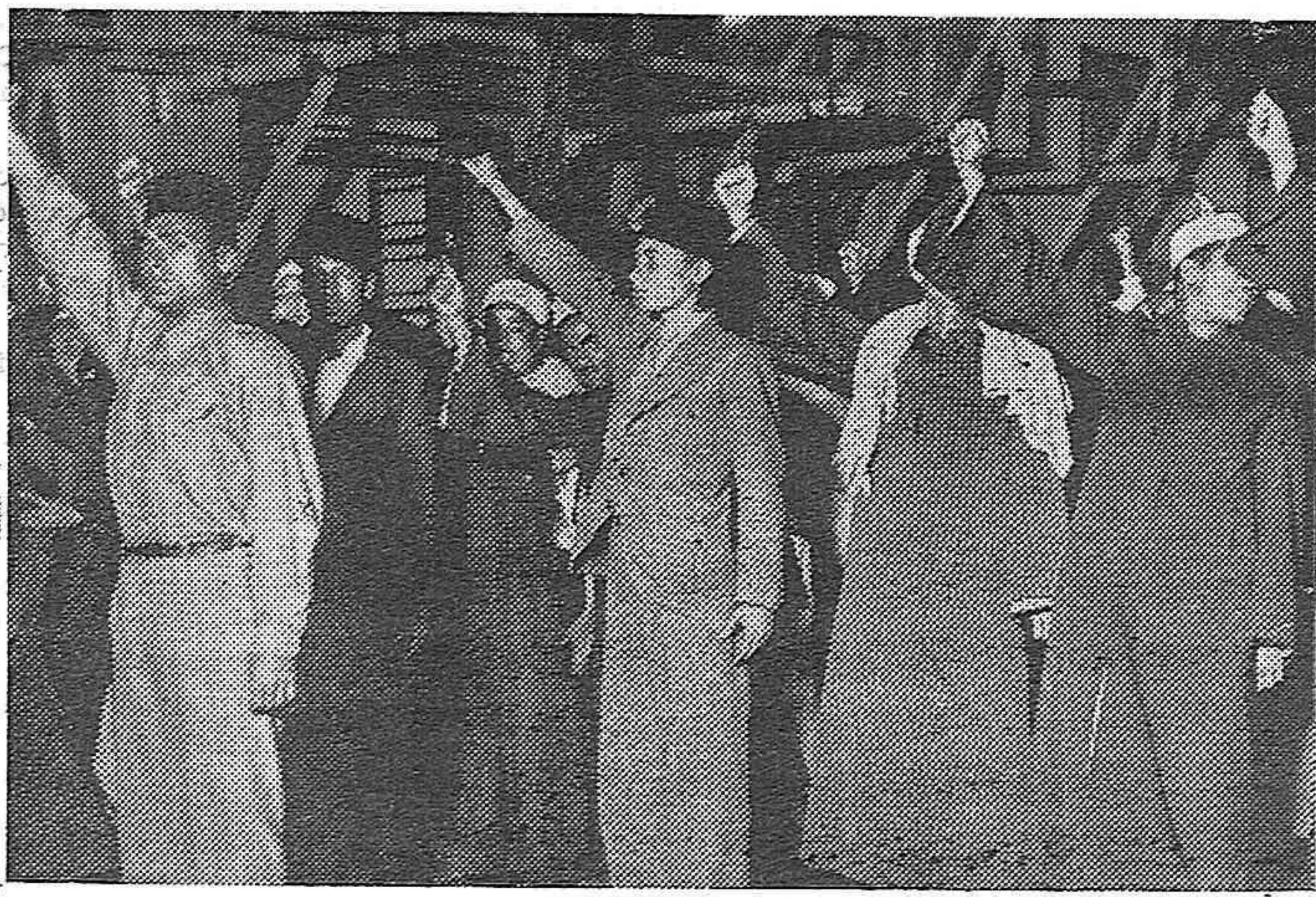
El partido político de los Wafds ha decidido usar camisas azules y pantalones grises, saludando a la manera fascista pero con el puño cerrado. -- Varios jóvenes del partido Wafds.