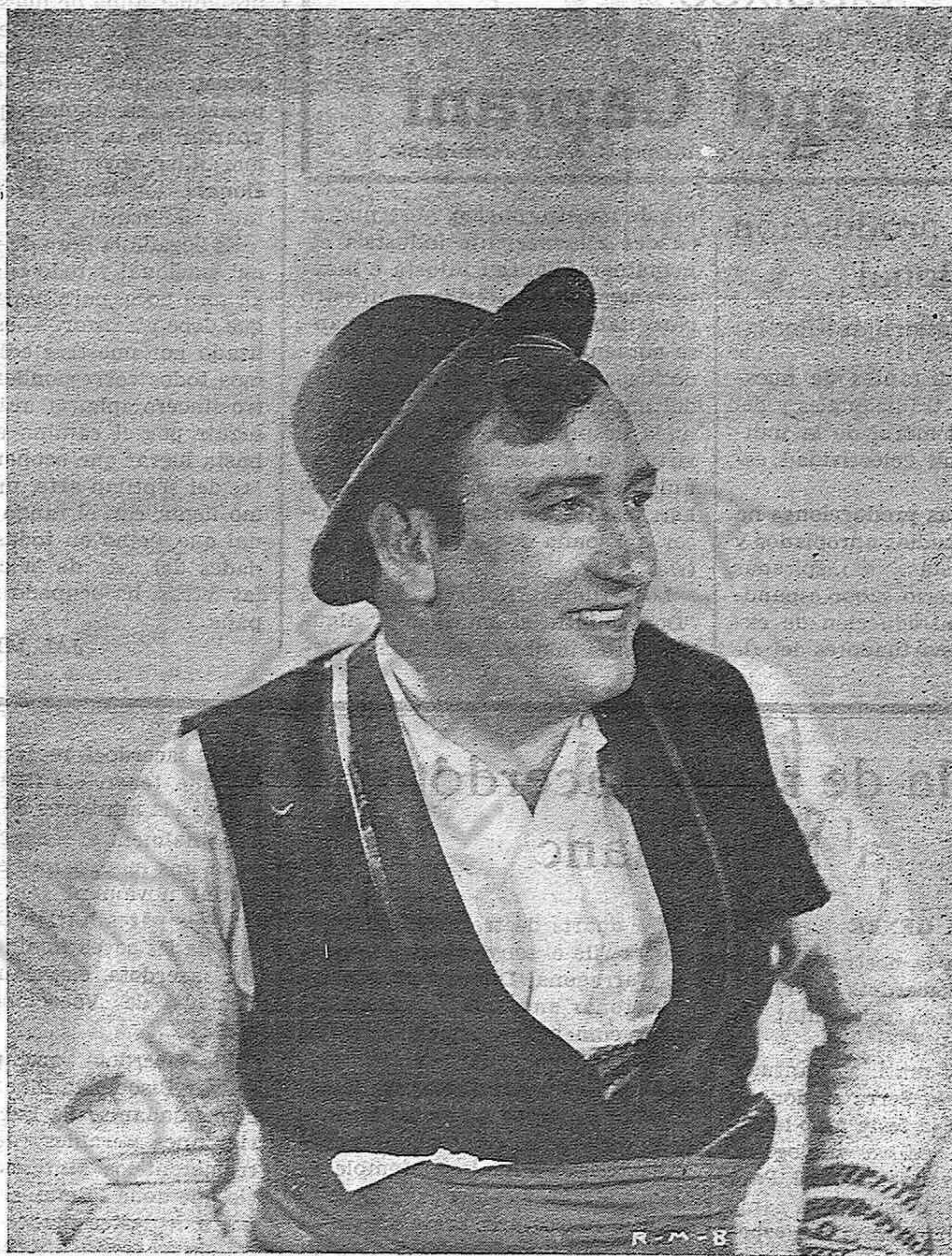
Miguel Fleta, el formidable divo de fama mundial, protagonista de "El último con-abandista", de la casa M. de Miguel.