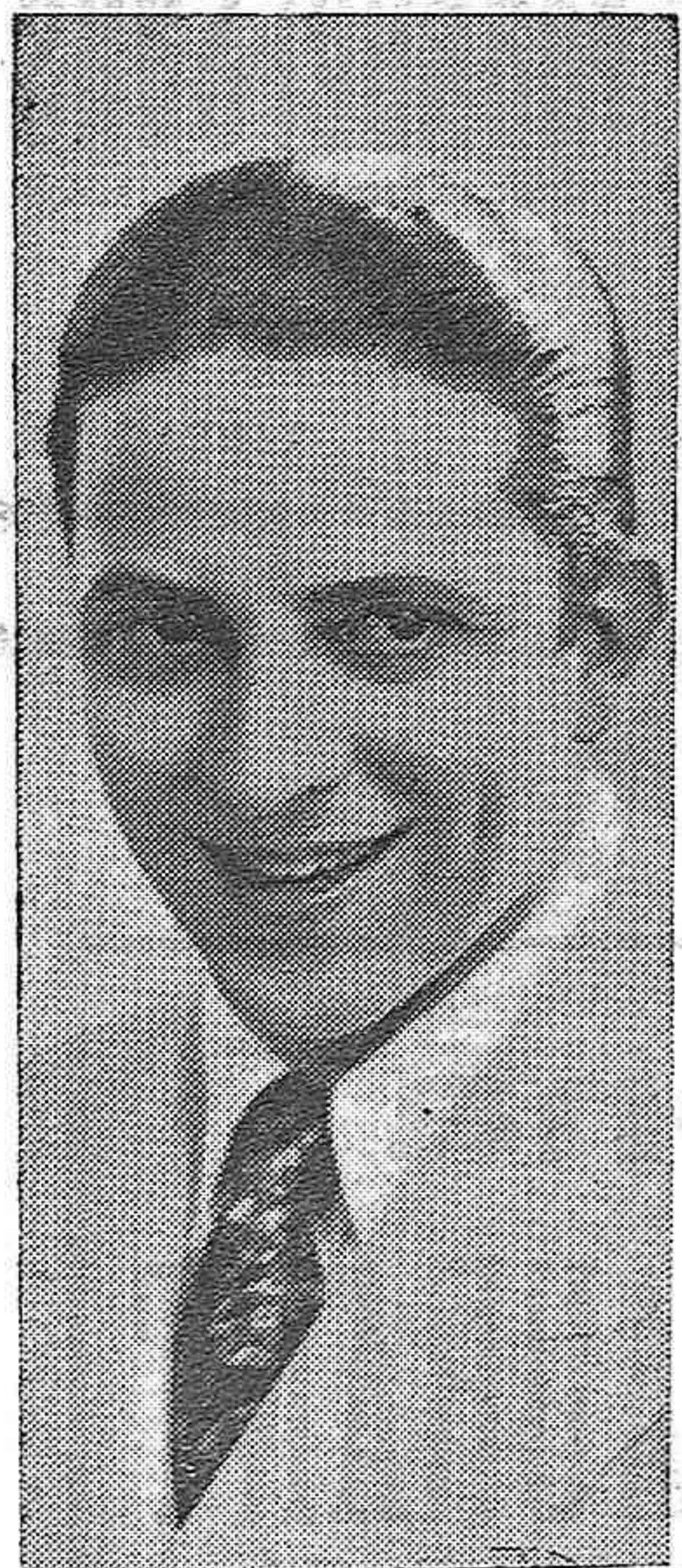
El popular actor Roberto Rey, intèrprete del "rol" de Julián, en la superproducció nacional de "Cifesa", "La Verbena de la Paloma".

re de vetllar pel desenvolupament intel·lectual i moral del públic, la qual cosa — va dir — constitueix l'honor de la professió.