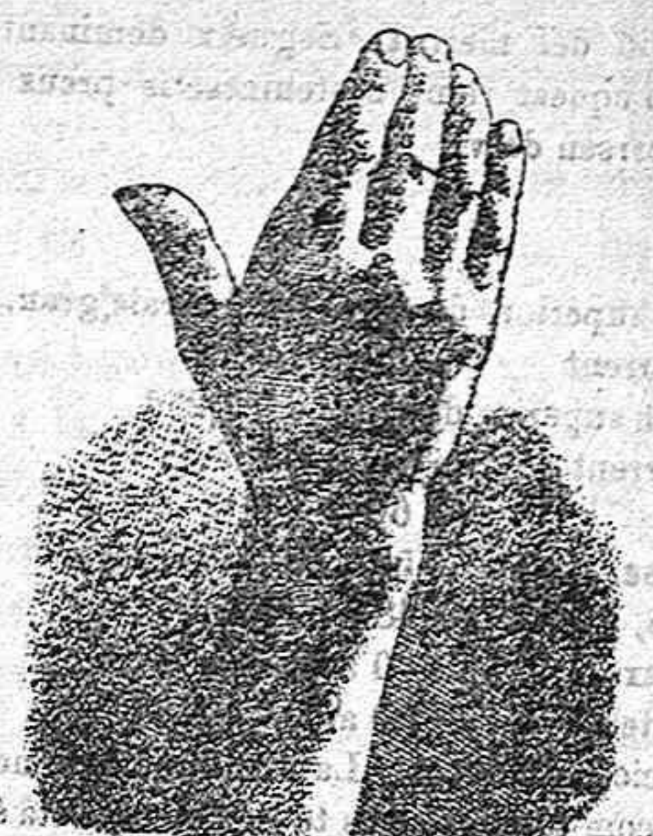
Después de 15 días del tratamiento