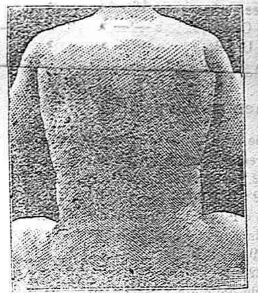
Después de 15 días del tratamiento