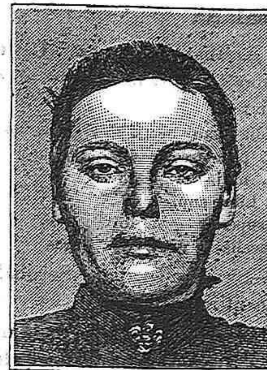
Despues de 15 dias del tratamiento