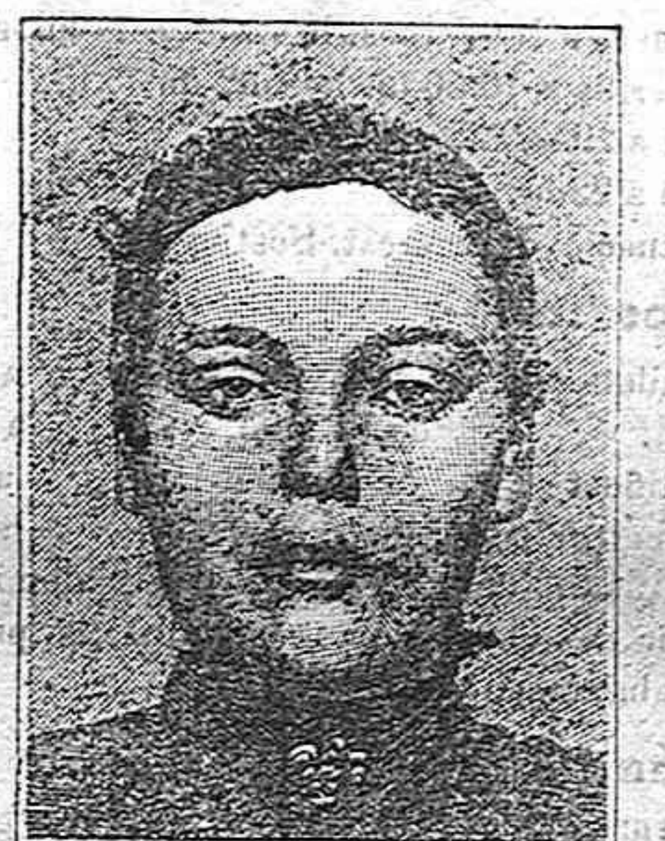
Después de 15 días del tratamiento