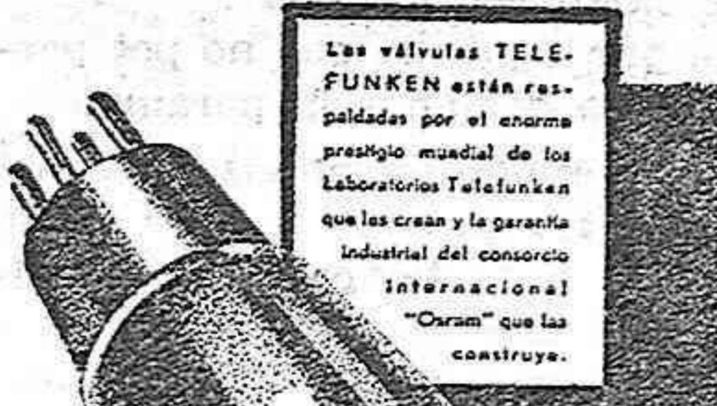
Las válvulas TELEFUNKEN están respaldadas por el enorme prestigio mundial de los Laboratorios Telefunken que las crean y la garantía industrial del consorcio internacional "Orvam" que las construye.

La experiencia de 30 años de especialización en la radio ha hecho de cada producto TELEFUNKEN - una obra maestra! Las válvulas TELEFUNKEN, son las de mayor rendimiento y duración.