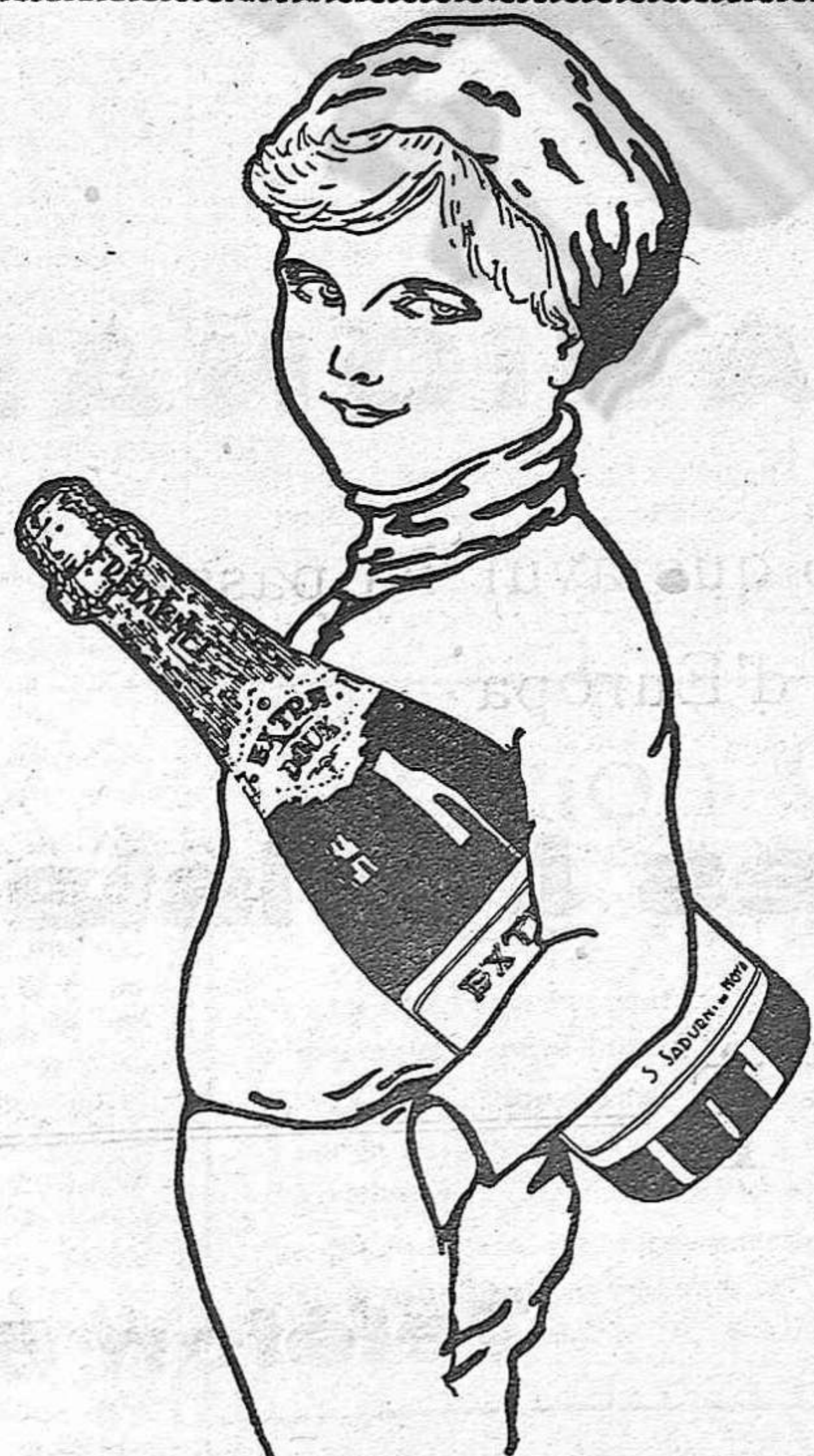
Sant Sadurn de Noya