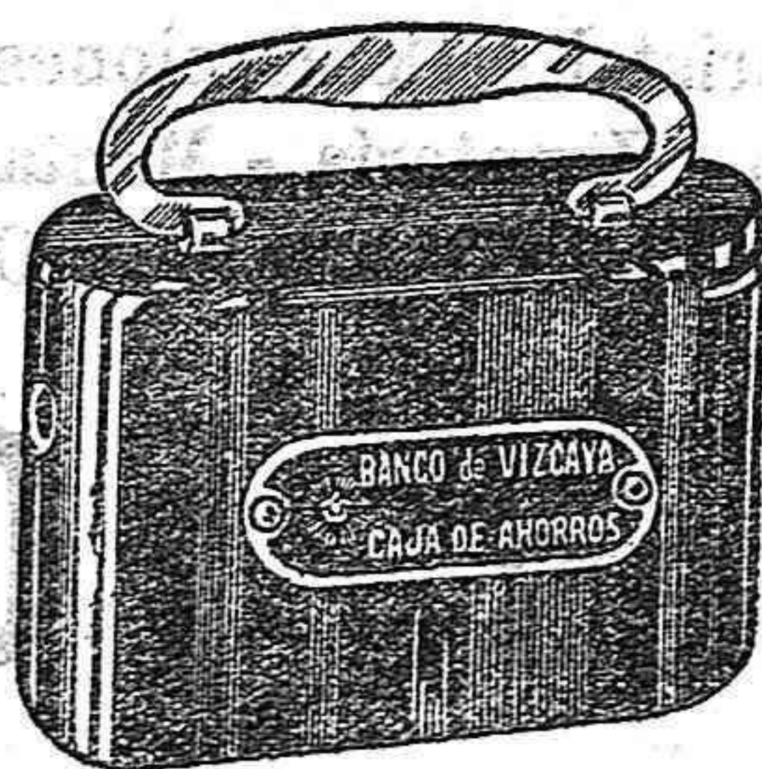
MODELO DE LAS HUCHAS (vidrioles) que está repartiendo gratis la CAJA DE AHORROS DEL BANCO DE VIZCAYA

Tiene derecho a la hucha toda libreta cuyo saldo o primera imposición no sea inferior a siete pesetas. Libretas sin hucha pueden abrirse desde la ínfima cantidad de una peseta. No se cobra absolutamente nada, ni por la libreta ni por la hucha.