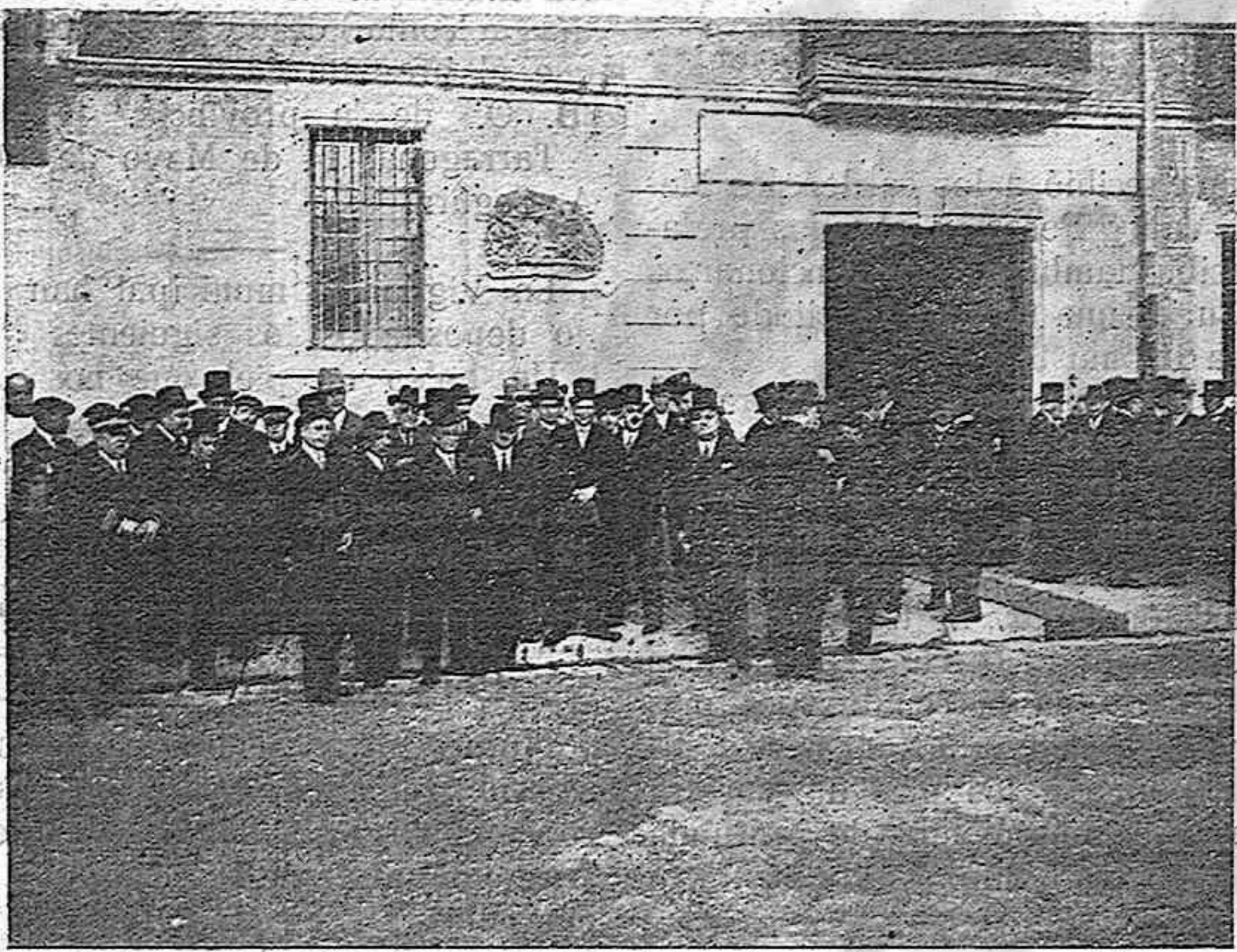
LAS AUTORIDADES Y COMISIONES DE ESTA CAPITAL, ESPERANDO AL SEÑOR NUNCIO

EL TEXTO DEL PRESENTE NUMERO HA SIDO SOMETIDO A LA PREVIA CENSURA