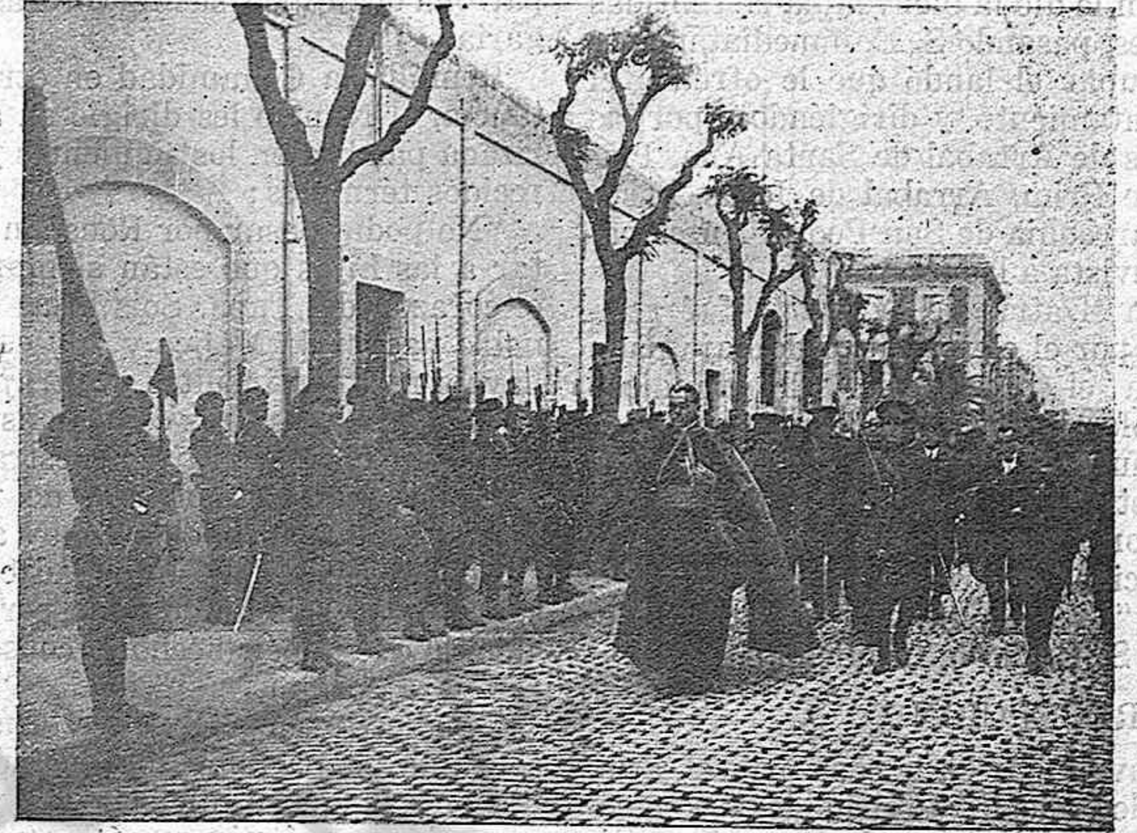
SU EXCELENCIA REVISTA LAS TROPAS

Terminados los números del programa, levantóse a hablar el señor Nuncio, entre una salva de aplausos de los concurrentes, que, puestos tam-