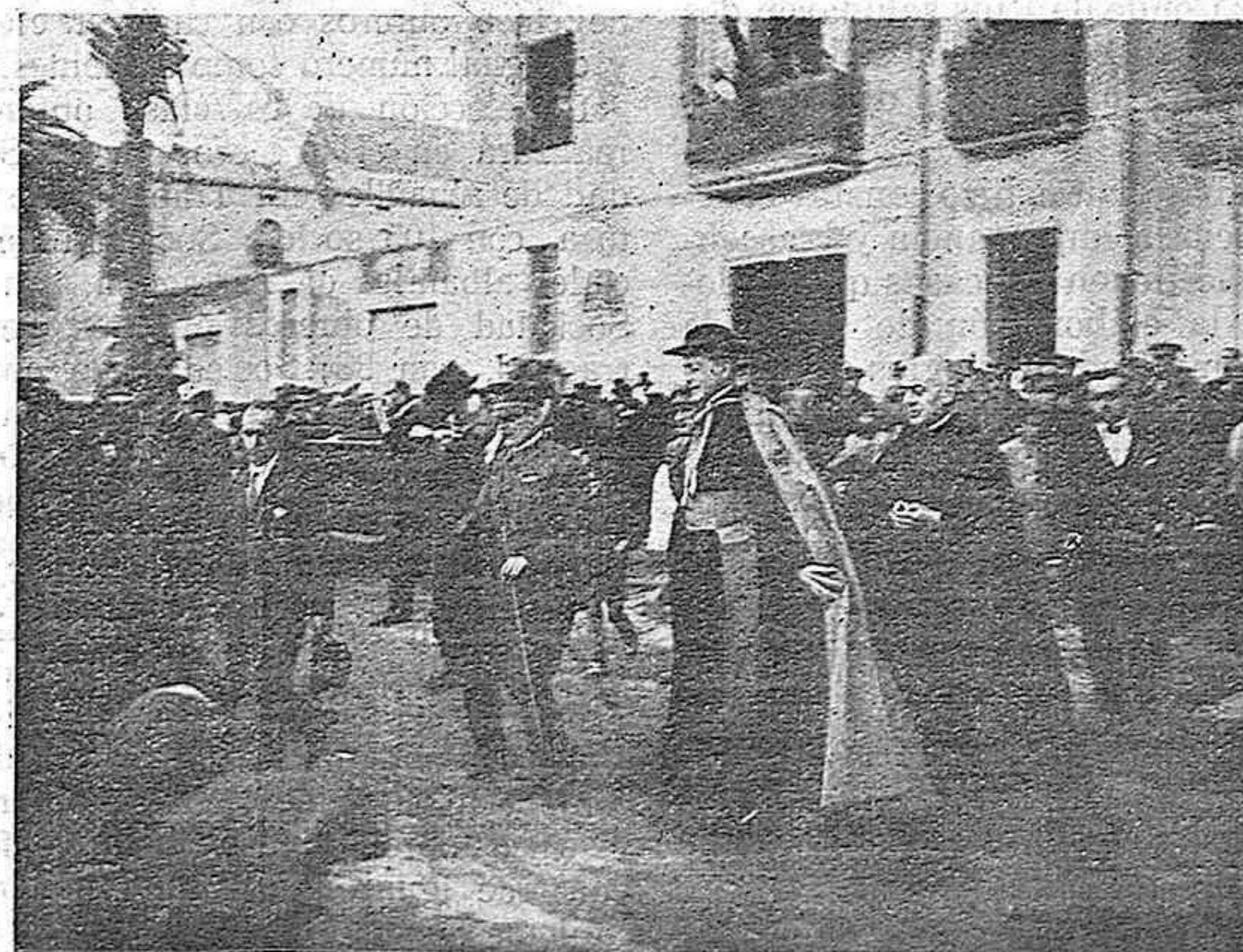
EL NUNCIO EN LA PLAZA DE LOS ARTILLEROS DEL SITIO

En el estrado presidencial se sentó en medio de los profesores el Sr. Nuncio que tenía a sus lados el Sr. Deán, Vicario general, teniente coronel Ba-