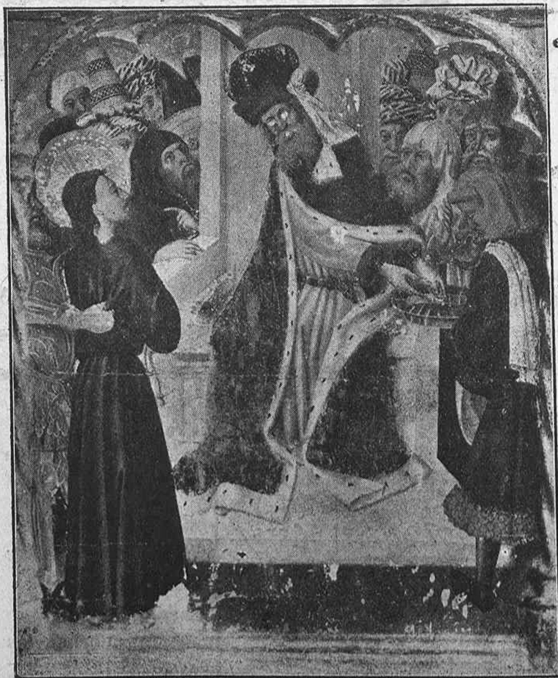
Retablo de la Pobra de Ciervols