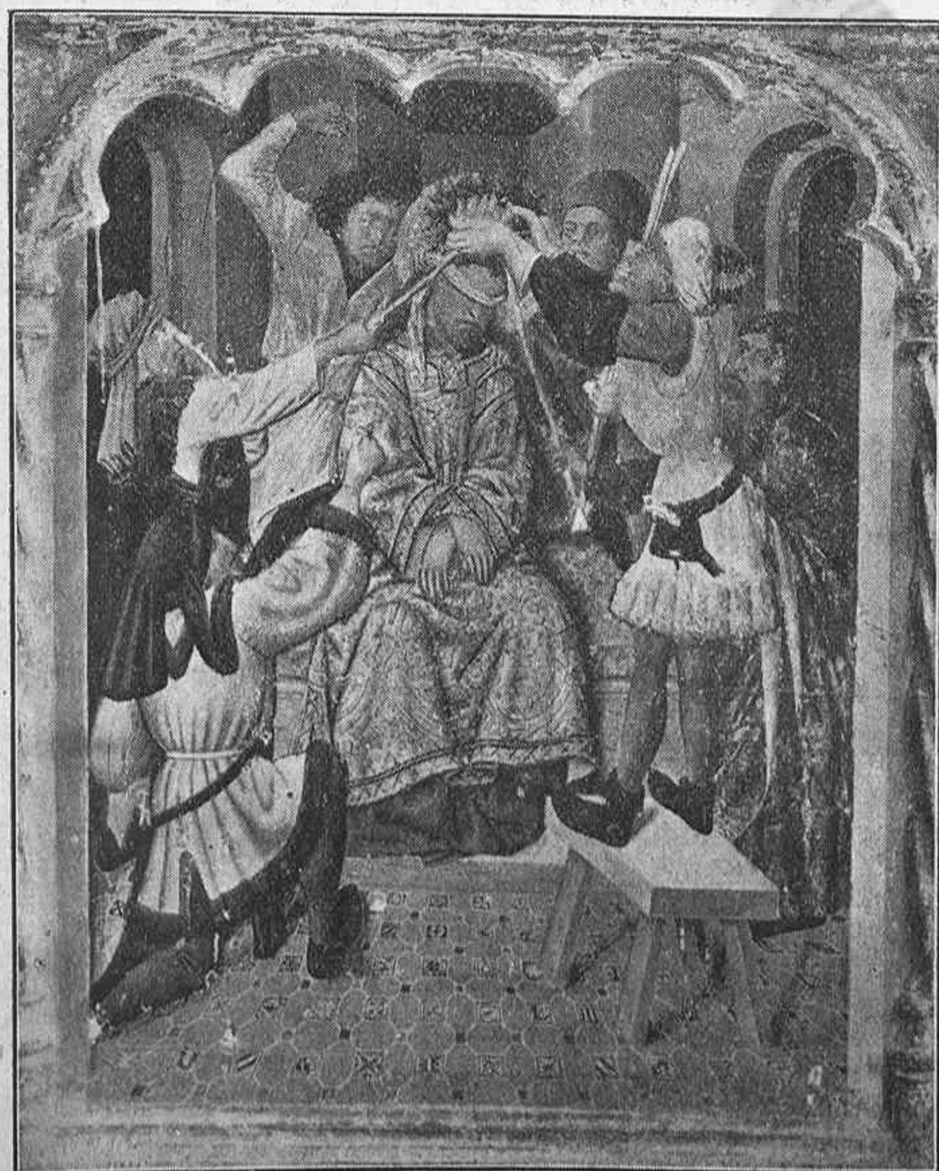
Retablo de la Pobra de Ciervols