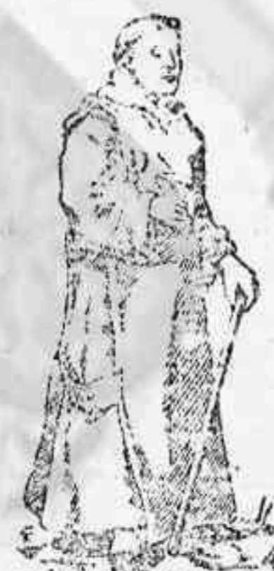
La naturaleza produce todo lo necesario al hombre para nutrirse, vestir y curarse.

compuesta únicamente de plantas medicinales