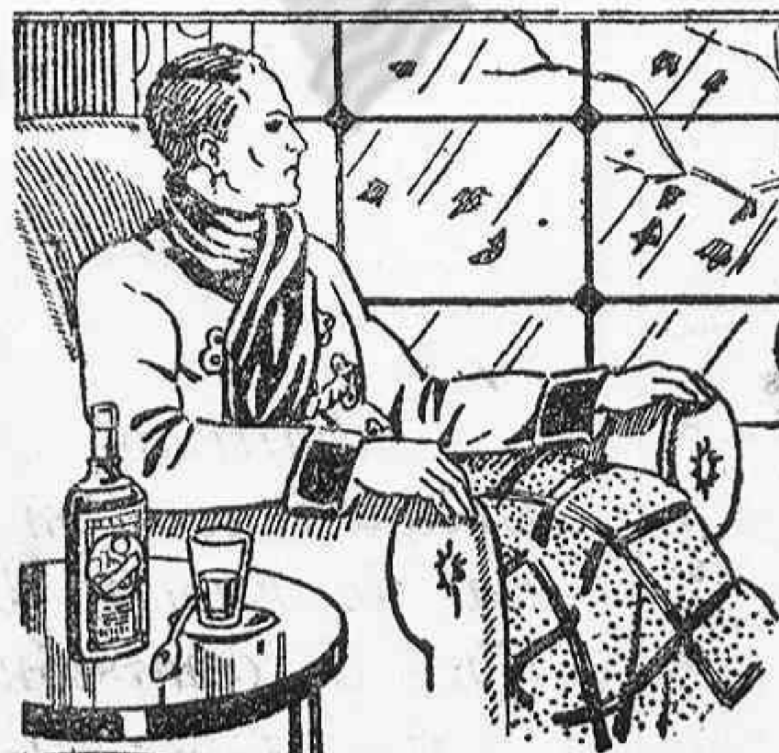
Se vende en todas las buenas Farmacias, a Ptas 5'00 el frasco

Ventas a plazos por medio del Crédito Ford